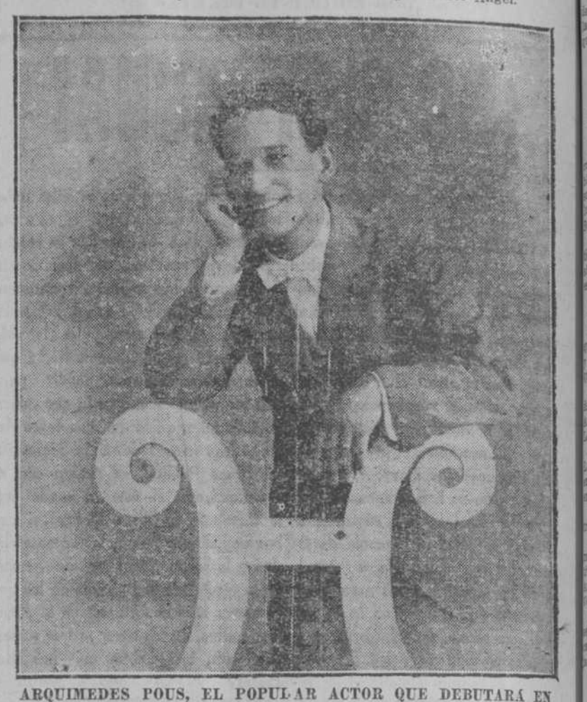
ARQUIMEDES POUS, EL POPULAR ACTOR QUE DEBUTARA EN PAYRET ESTA NOCHE, CON SU COMPANIA DE ZARZUELA CUBANA