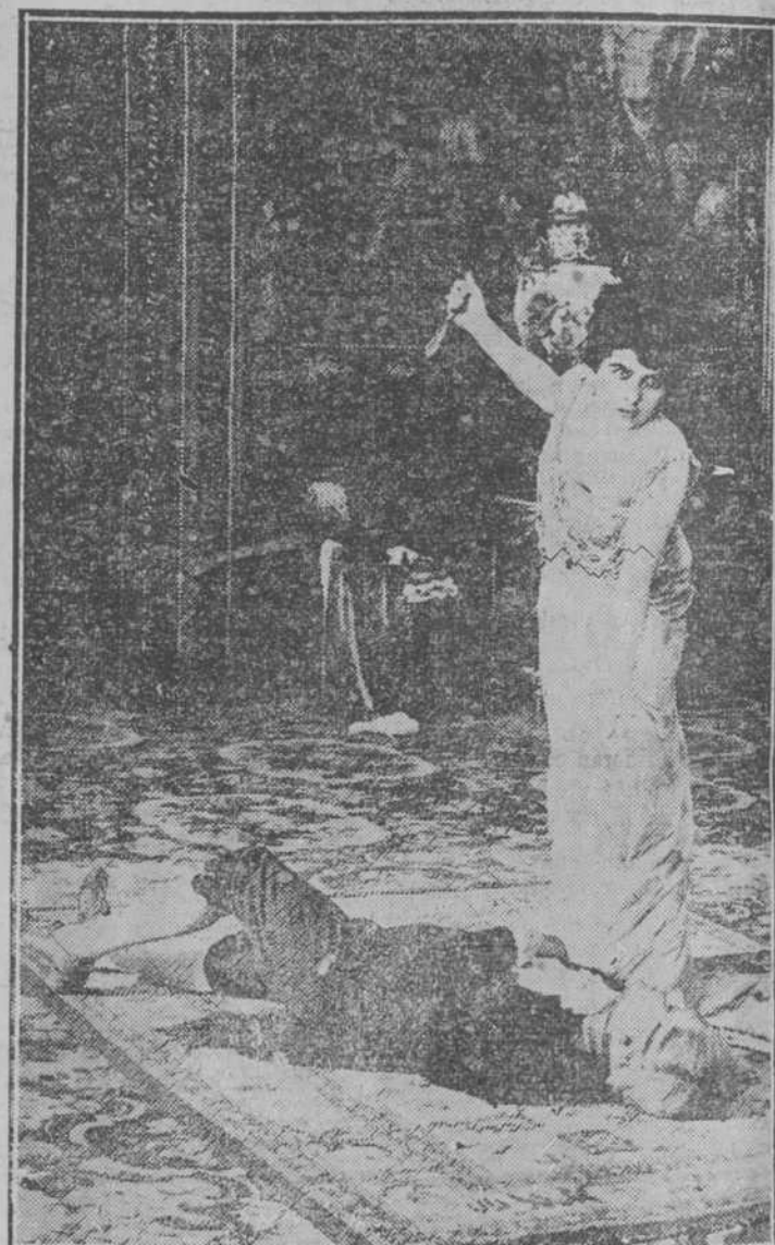
Hace un momento toda Roma temblaba ante él. 5d-20