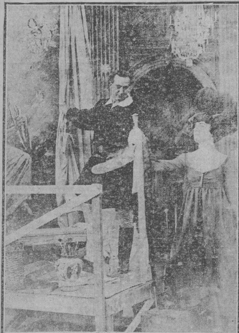
El hermoso cuadro que Mario pintaba en la Iglesia de San Andrés, despierta los celos de Tosca. El artista había reproducido el bello rostro de la Marquesa Allavante.

Las localidades están a la venta en la contaduría de Payret. Separe la suya con tiempo.