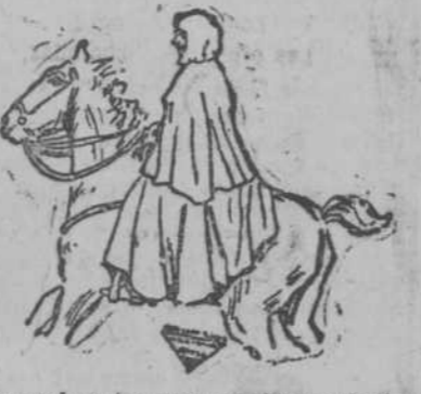
Con vuelo extra para montar a caballo.