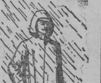
Para andar a pie, en distintas clases y colores.

Trajes y capas amarillas embreadas, para marinos, motoristas y trabajadores del campo.