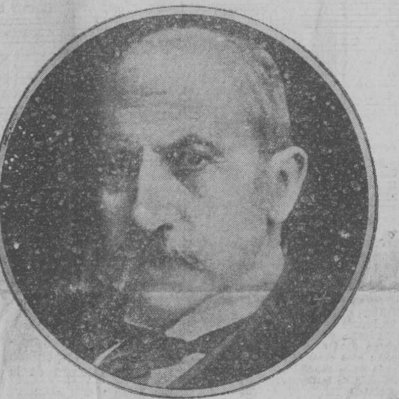
BARON MILNER, MINISTRO DE LA GUERRA DE INGLATERRA

Pequeño moralmente y equivocado, publicó el general Maurice una carta en que desmentió los datos con que Lloyd George devolvió la confianza al pueblo inglés desde la Cámara, dicién-