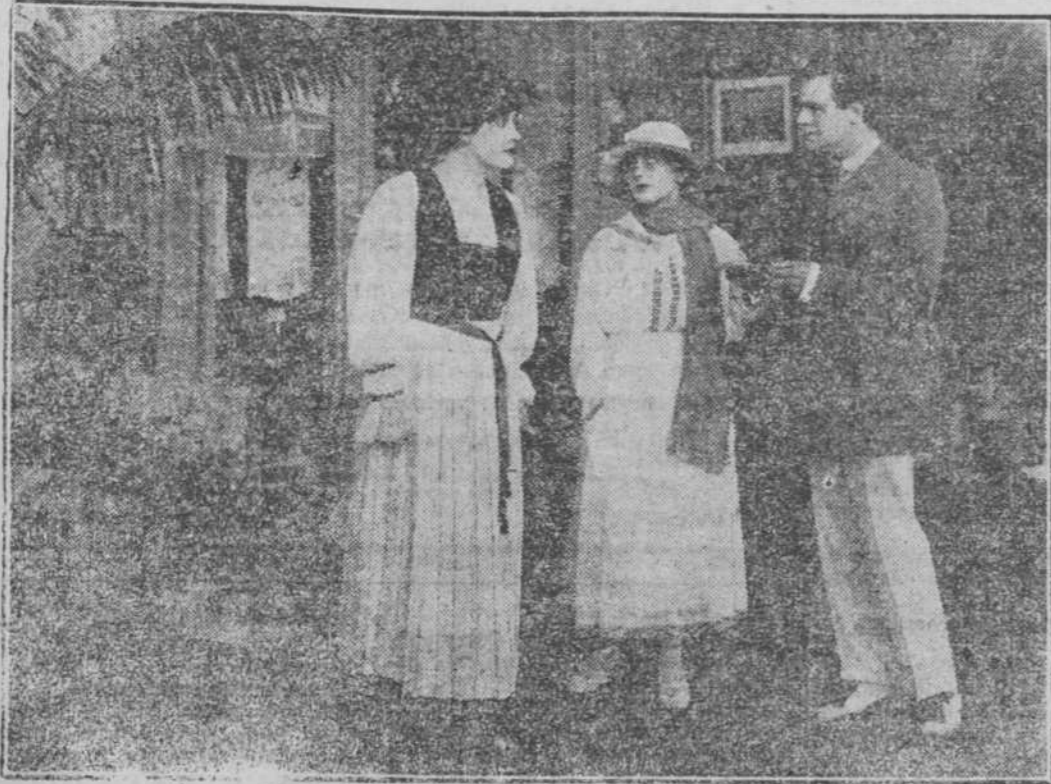
Una escena de EL AIGRETTE.-Hesperia