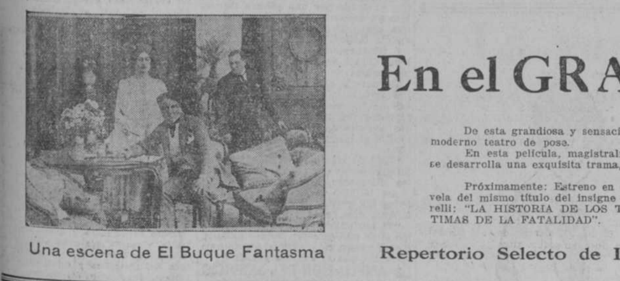
Una escena de El Buque Fantasma

FOLLETIN 44 UN CAPITAN DE QUINCE AÑOS SEGUNDA PARTE OPRA ESCRITA EN FRANCES POR JULIO VERNE VERSION ESPAÑOLA De venta en La Moderna Poesía, Obispo, 132 y 130. sangre corre de su espalda lacerada a latigazos. Por la noche hemos acampado bajo un enorme bambú de flores blancas y de un follaje verde claro. Durante la noche he oído el rugido de los leones y de los leopardos. Uno de los indígenas ha disparado su flecha contra una pantera. ¿Qué habrá sido de Hércules? Del 1 al 6 de mayo.—Hemos atravesado en varias marchas largas llanuras que no han podido descender todavía con la evaporación. A veces hemos tenido aguas hasta la cintura. Millares de sanguijuelas se adherían a la piel, y ha sido preciso marchar entre ellas. En algunas alturas he visto plantas del loto y papirus, y en el fondo bajo las aguas, otras plantas de grandes hojas, como coles, en que tropiezan los pies, lo cual ocasiona muchas caídas. En estas aguas hay gran abundancia de pececillos de la especie de los sturos que los indígenas pescan por millares en estos pantanos y venden a las caravanas. Imposible encontrar agua dulce durante la noche. Después de haber estado un día en el campamento, me he dirigido a la llanura inundada; mañana habré acumulado muchos esclavos; ¿qué trabajo! Cuando uno cae, ¿por qué le-