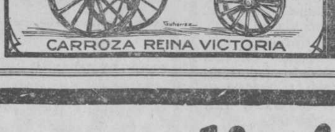
CARROZA REINA VICTORIA

La HORSINE se vende EN TODAS LAS BUENAS FARMACIAS