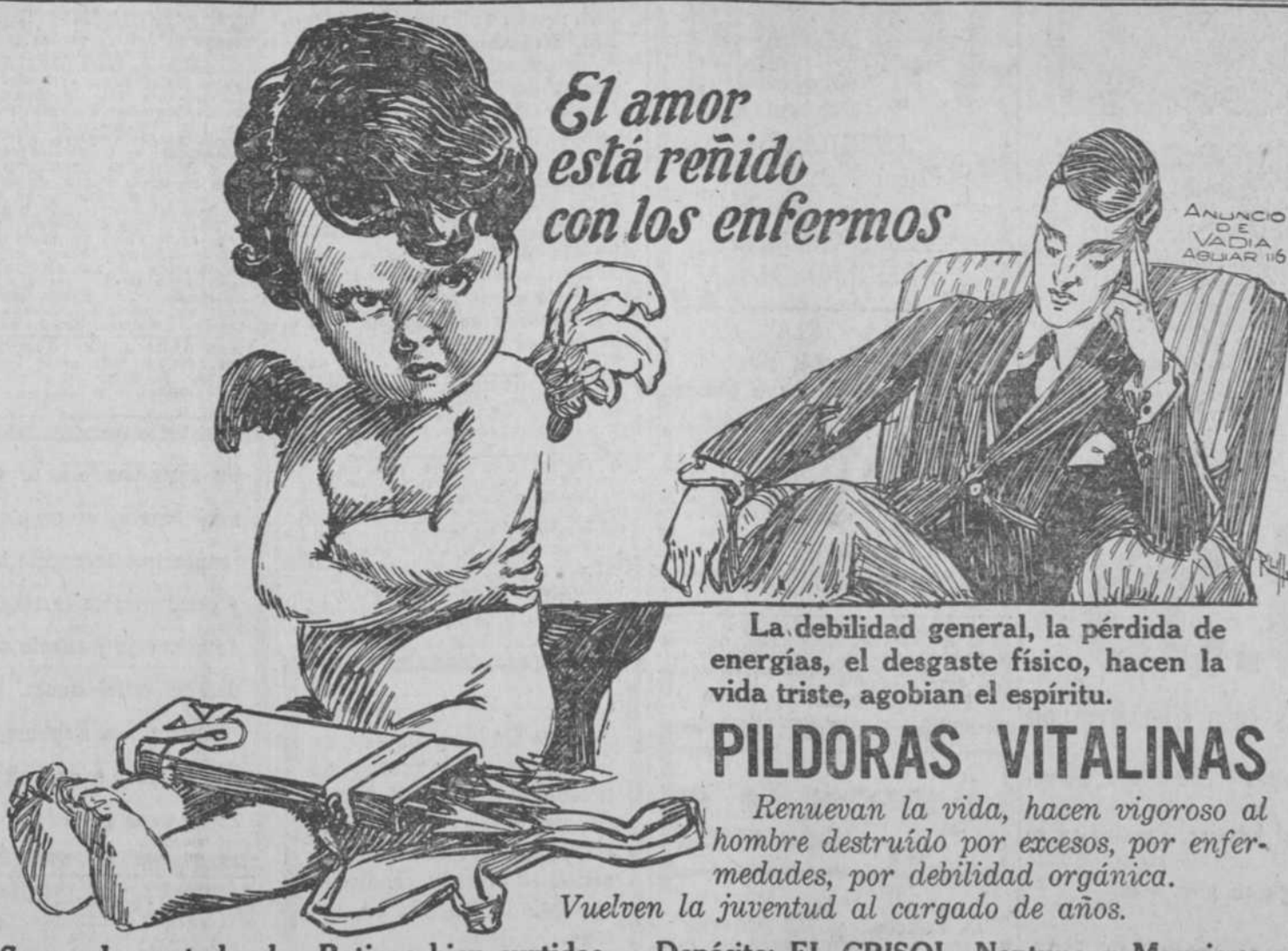
El amor está reñido con los enfermos

J. A. Bances y Cia. BANQUEROS OBISPO, NUM. 21