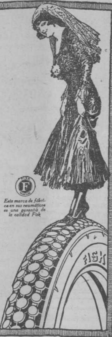
Este marca de fábrica en sus neumáticos es una garantía de la calidad Fisk

Recomendamos con el mayor entusiasmo los neumáticos "RED TOP" de Fisk. Distribuidores para Cuba GARAGE HABANA Zulueta y Gloria Sts. HABANA De venta en los garages principales de Cuba. Se da pronta atención a las preguntas de los comerciantes.