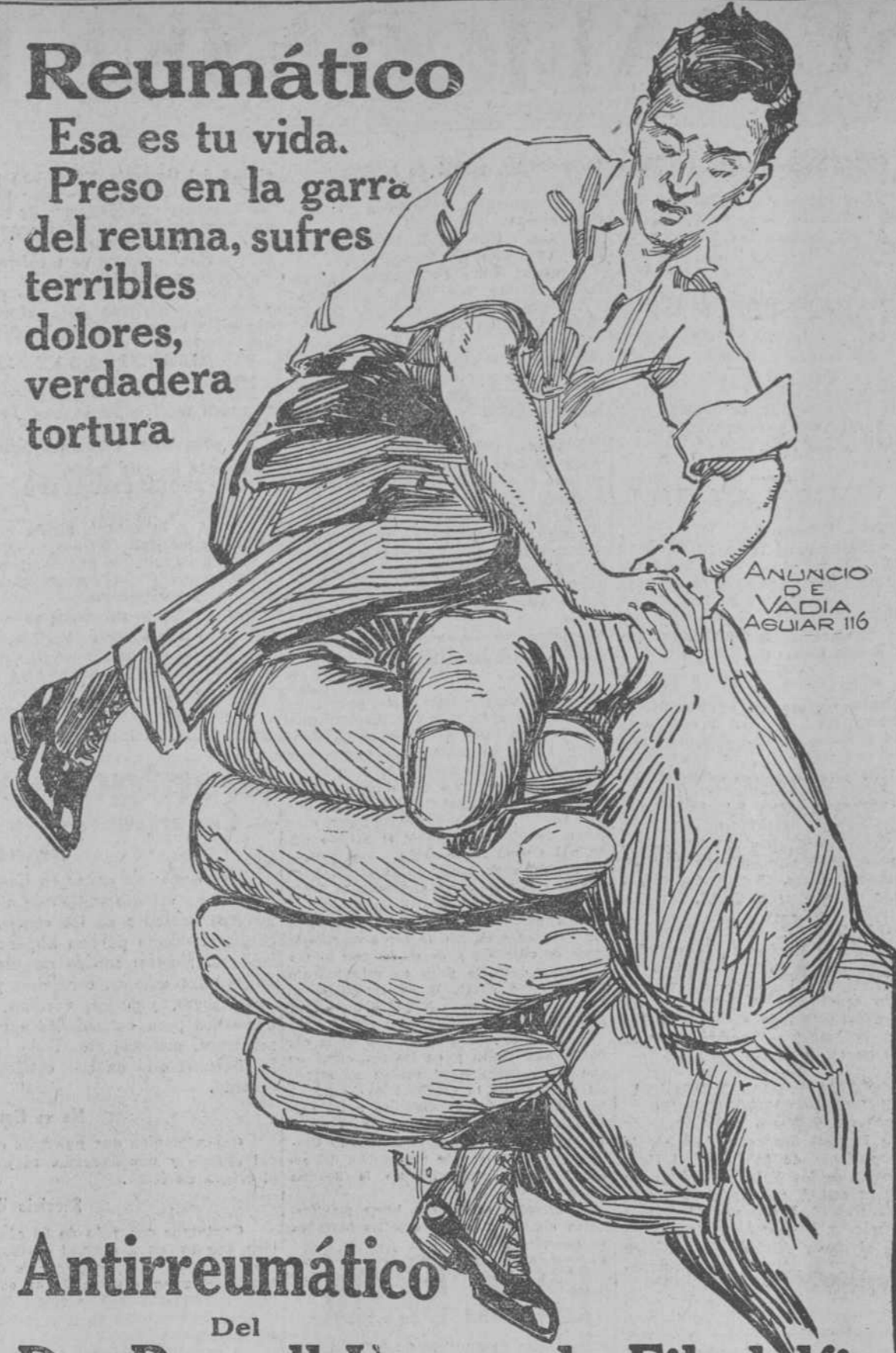
ANUNCIO DE VADIA AGUIAR 116

Esa es tu vida. Preso en la garrá del reuma, sufres terribles dolores, verdadera tortura