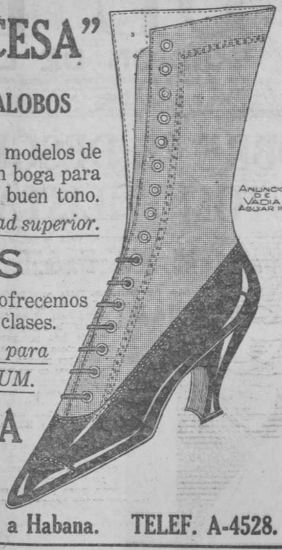
ANUNCIO DE VAGAS AGUIAR 15

LA PRINCESA Peletería Para Elegantes. MURALLA 45, esquina a Habana. TELEF. A-4528.