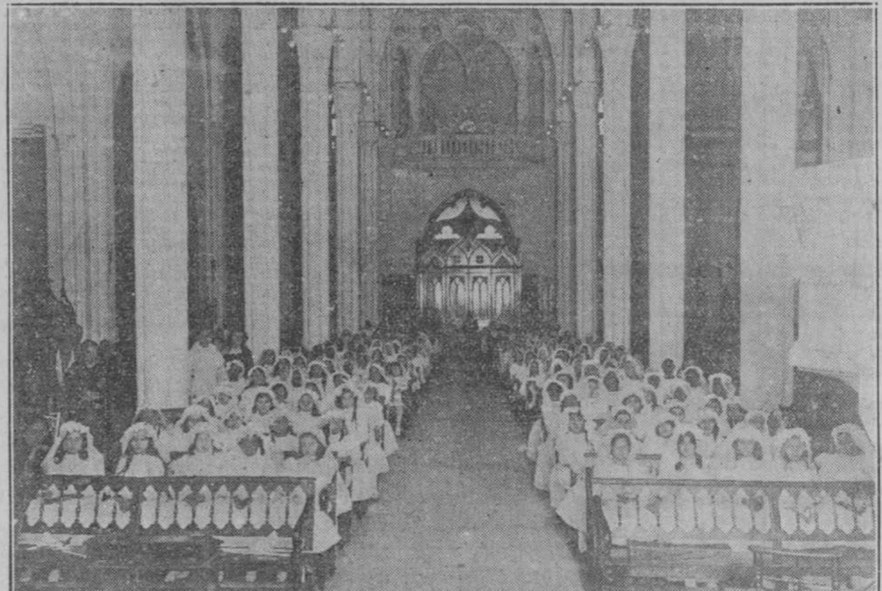
ALUMNOS DE LA ESCUELA CATEQUISTICA DE LA IGLESIA PARROQUIAL DEL VEDADO, QUE COMULGARON EN LA MISMA EL 12 DEL ACTUAL.