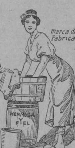
ANUNCIO DE VADIA AGUIAR 116

LA ROPA SUCIA SE LAVA EN CASA PERO CON JABÓN CANDADO