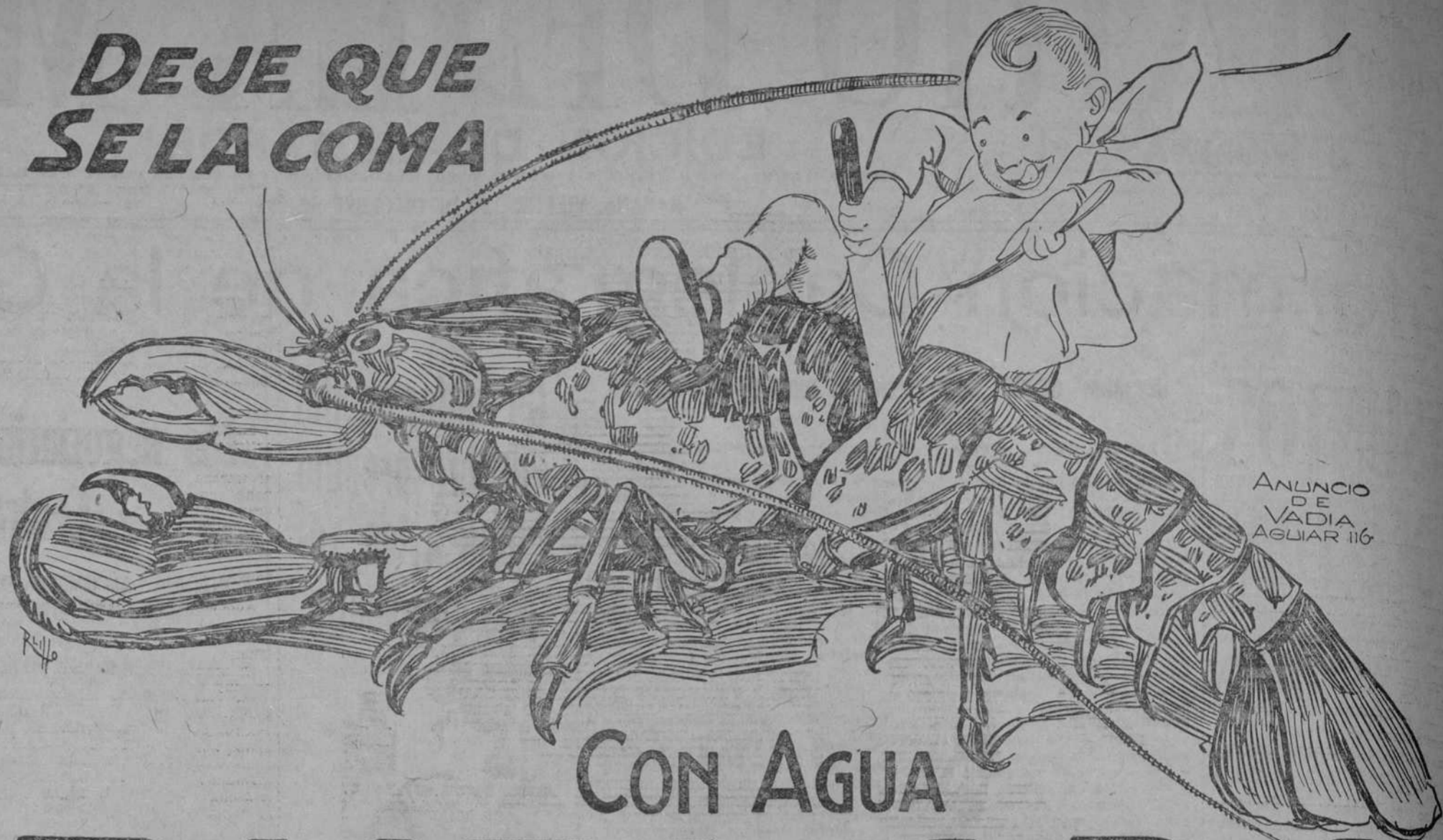
ANUNCIO DE VADIA AGUIAR 116