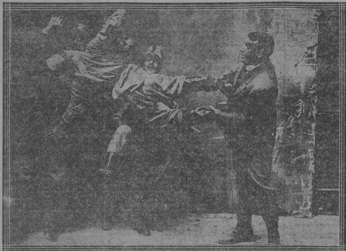
A falta de un buen garrote no tuvo más remedio que defenderse usando como arma a uno de sus mismos enemigos... lo levantó por los pies y con él pegó repetidas veces contra sus carceleros. Parecía increíble tal alarde de fuerza y valor.

En el Teatro "Payret." Hoy, Martes, 1º, Hoy