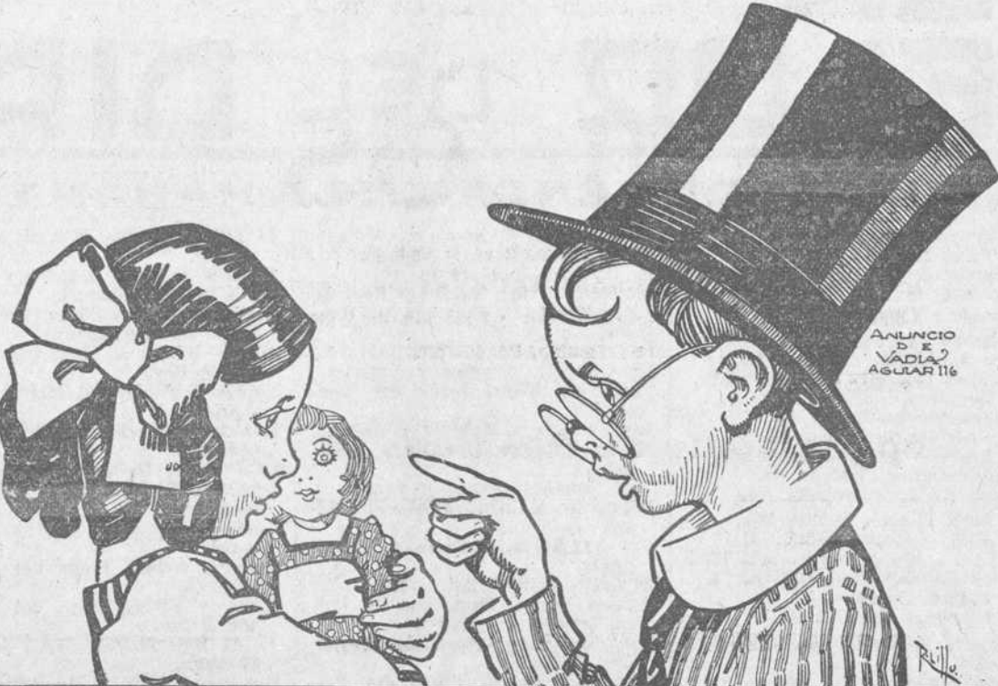
ANUNCIO VADIA Y AGUIAR 116

El Ministro de los Estados Unidos ha enviado a la Secretaría de Estado un proyecto de Tratado, para que sea considerado por el Gobierno de Cuba, con objeto de regular las licencias de los viajantes comerciales y el trato aduanero de sus muestras.