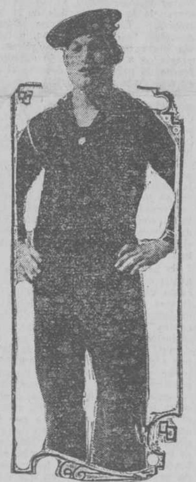
EL HOMBRE DE GOMA POR INJURIAS