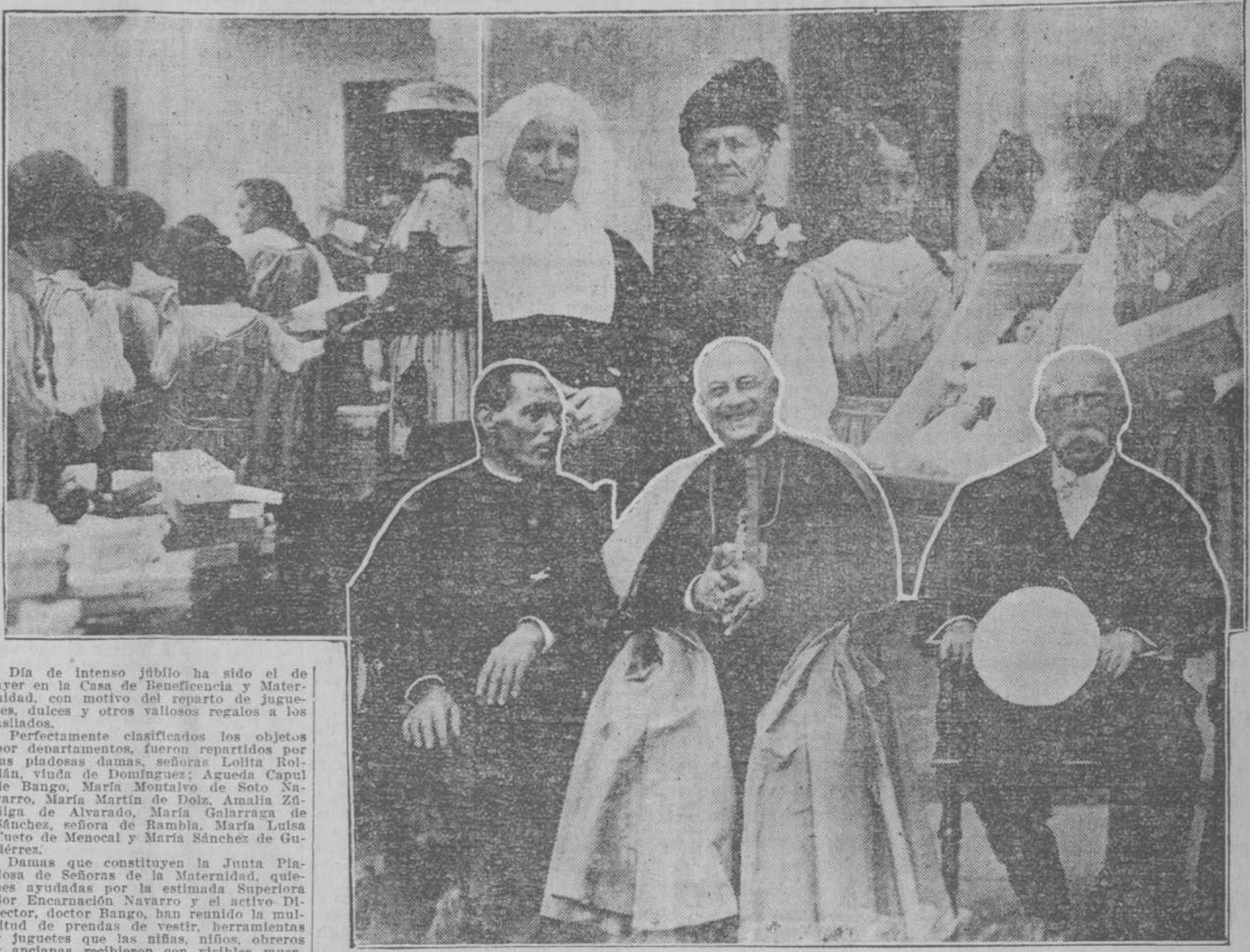
1.—Niños recibiendo los juguetes. 2.—Niños contemplando los regalos recibidos. 3.—El Delegado Apostólico, Director y Capellán de la Beneficencia y Maternidad, presenciando la distribución de objetos a los expósitos.

El señor Conde de Romanos dice que España no se ha adherido a las notas americana y suiza relativas a la paz. ¿A qué espera? Parece algo fatidico que en momentos tan dificiles como éstos sea un cojo el que se halle al frente de los destinos de una nación.