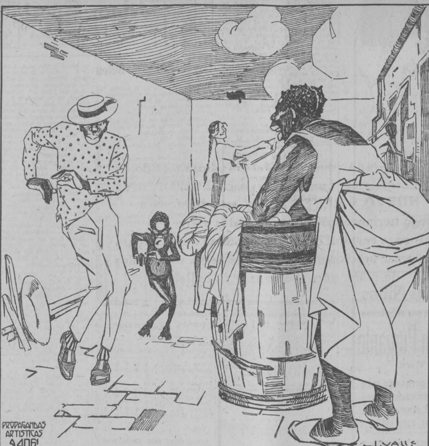
PROPAGANDAS ARTISTICAS 44061

MANIFIESTO 975—Vapor americano MUMPLACE, capitán Combes, procedente de Mobile, consignado a Munson S. S. Line.