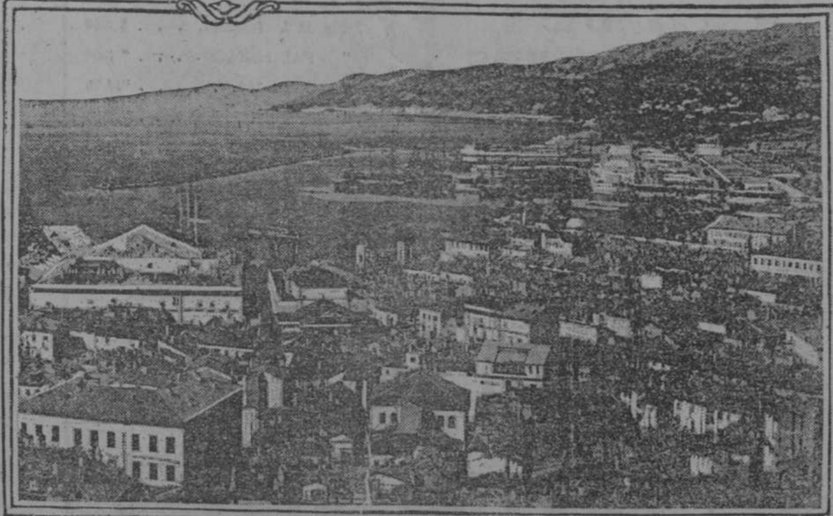
TRIESTE, ACTUAL OBJETIVO DEL ATAQUE ITALIANO