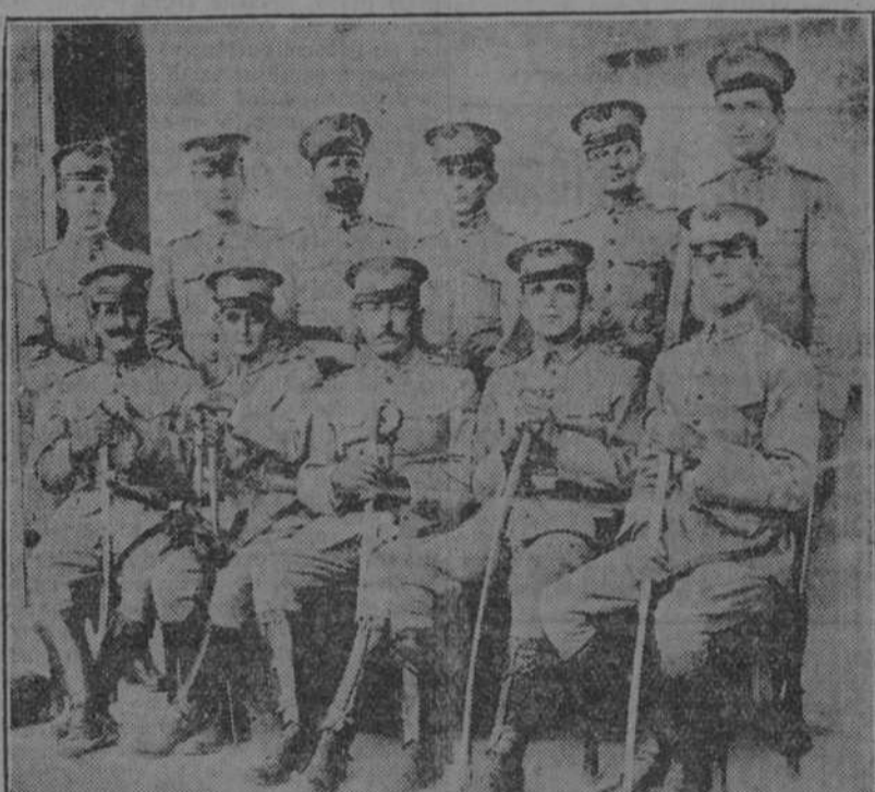
JEFES Y OFICIALES DE LA GUARNICION EN PINAR DEL RIO TERCIO TACTICO DEL REGIMIENTO "CESPEDES" NUMERO 4 DE CABALLERIA

PROPIETARIA: Monument Chemical Co., de Londres, 15 Fish Street Hill, Monument Square, Londres.