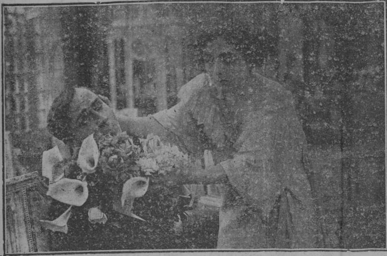
Y el perfume sensual de su cuerpo, unió el de aquellas flores a las que hizo cómplices de su obra de seducción. La tracción del amigo predilecto, era el complemento que necesitaba para la ruina moral de sus víctimas... ¿Cómo resistir al contacto de aquella mujer?... ¿Cómo librarse de sus garras de Eva tentadora?...

¿Por qué Francesca Bertini está considerada en todo el mundo como la actriz más perfecta del teatro del gesto?... ¿Por qué su nombre ha despertado la admiración de todos los públicos?... ¿Por qué ella triunfa en todas sus obras sin esfuerzos ridículos ni exageraciones inútiles?... Sencillamente, porque ella con su gracia natural y su arte espontáneo es un astro de primera magnitud que llega a eclipsar a todas las estrellas de la constelación cinematográfica. Hay que ver a la Bertini en "LAGRIMAS QUE REDIMEN," para convencerse una vez más de que esta genial artista no tiene rival en el teatro del drama silencioso! Hay que verla en esta notable creación para poder darse cuenta de su facilidad para interpretar dos caracteres completamente opuestos: primero el de la joven modesta y virtuosa, y más tarde el de la cortesana que apela a todos los recursos para dominar al hombre a quien quiere hacer objeto de sus burlas y de sus venganzas. La sociedad habanera, ferviente admiradora de la Bertini, se congregará nuevamente en el SALON TEATRO PRADO, EL JUEVES, 14, para verla en la película "LAGRIMAS QUE REDIMEN." Las personas que deseen localidad para este Jueves, titulado JUEVES BERTINI, deben pedirla a tiempo a Santos y Artigas. Manrique, 138. Teléfono A-1564. El mejor circo que ha venido a Cuba: El "Circo Santos y Artigas" debutará en Noviembre en el Gran Teatro Payret. La Bertini ha alcanzado en "Lágrimas que Redimen" su más resonante triunfo.