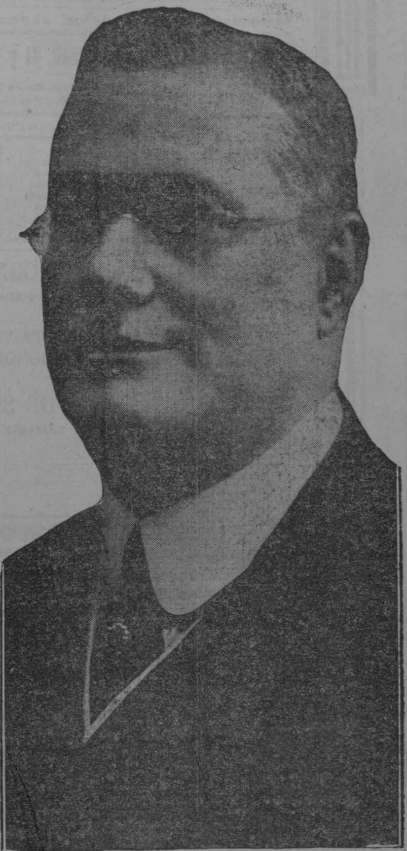
Eugenio Leopoldo Azpiazo, candidato a la Alcaldía Municipal de la Habana.