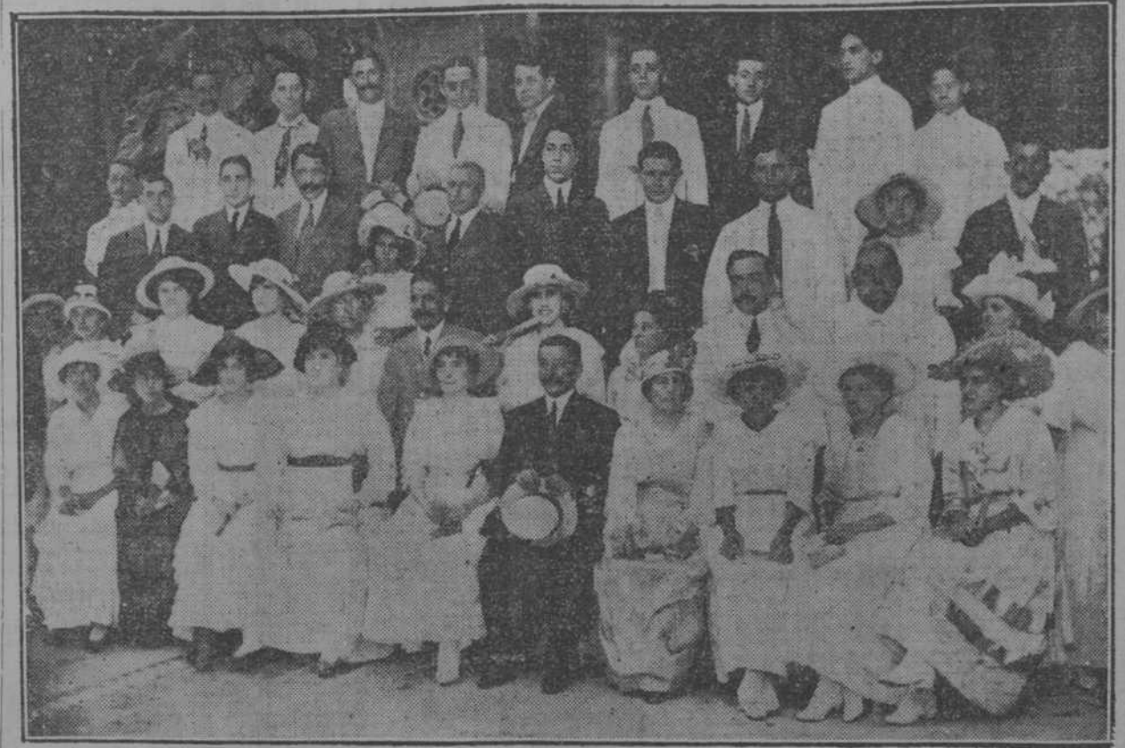
GRUPO DE CONCURRENTES A LA BRILLANTE FIESTA

Brillantisima por todos conceptos resultó la gira que celebraron ayer los socios de esta novísima colectividad.