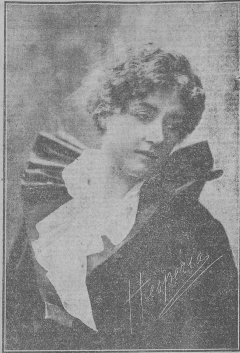
HESPERIA LA GRAN ACTRIZ ITALIANA. Famosa por la elegancia de sus tolletes y la sobriedad de su gesto...

Notable estreno presentado por SANTOS y ARTIGAS