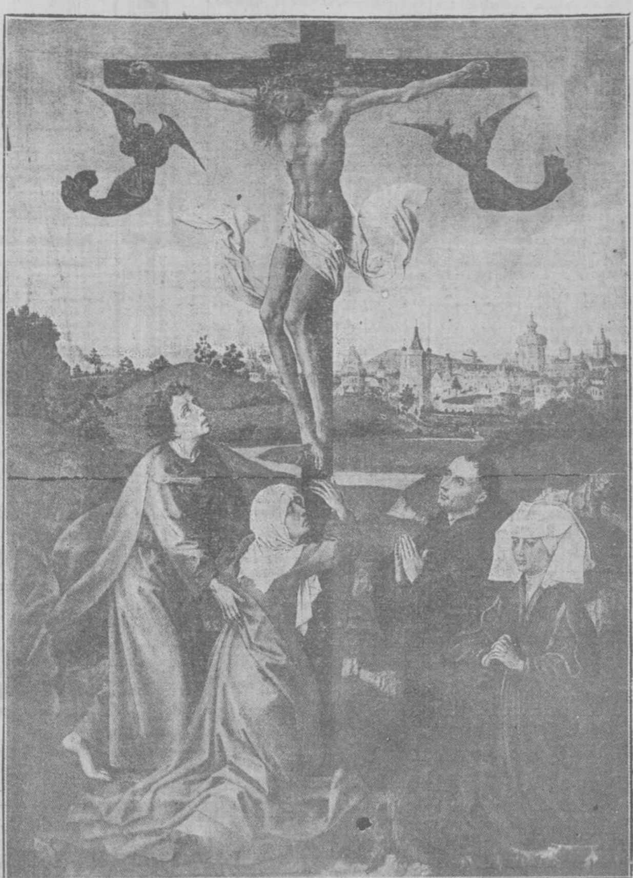
LA CRUCIFIXION. TABLA CENTRAL DE UN TRIPITICO, POR ROGER DE LA PASTURA (ROGER VAN DER WEYDEN), EXISTENTE EN LA GALERIA IMPERIAL DE VIENA.

Oficialmente se anuncia que la nueva ley de minas de México se pondrá en vigor dentro de unos cuantos días.