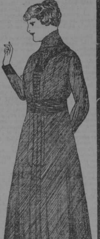
Vestido de sarga en colores de moda, todas tallas. Precio $2.50.