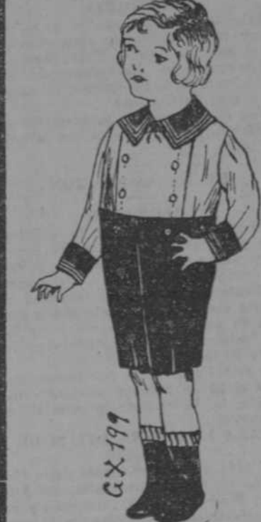
Trajecito para niños de 2 a 6 años hecho en tela azul prusta y blanco con adornos de trenzalla. Precio desde $0.75.

Todas las tiras bordadas, encajes y adornos para vestidos a mitad de precio.