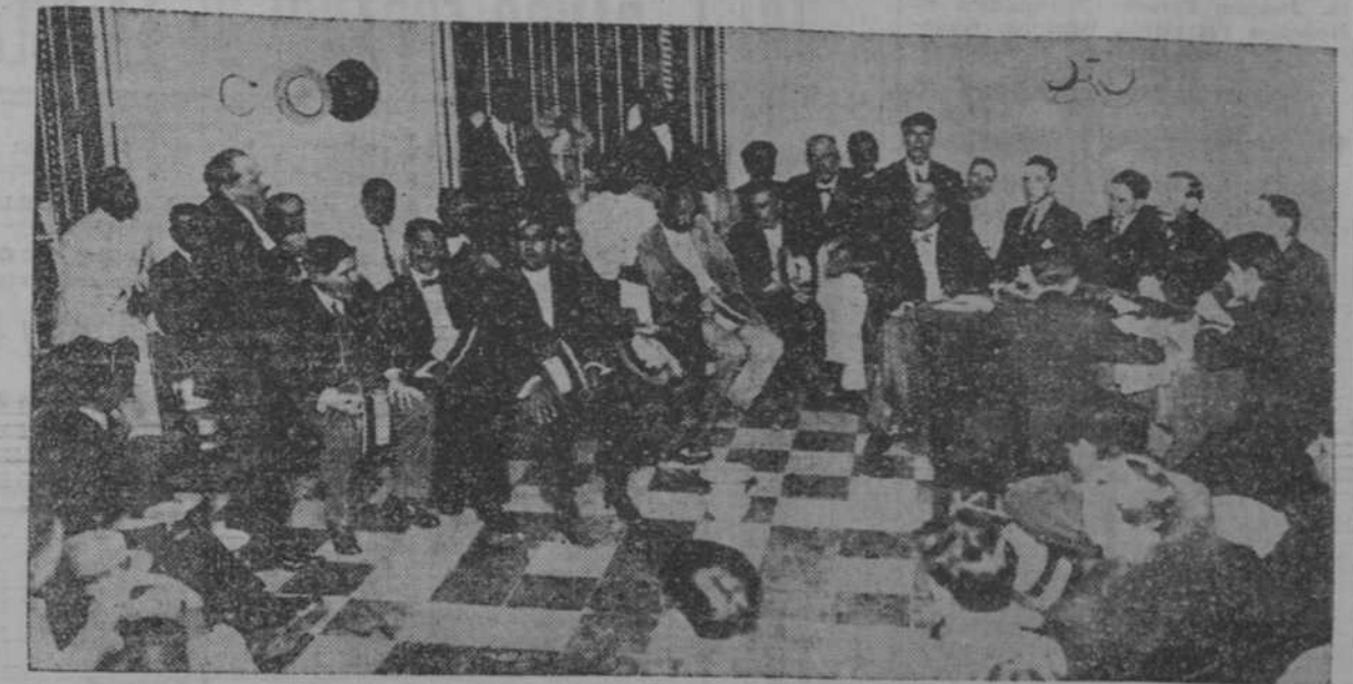
LOS OBREROS EN LA JUNTA CELEBRADA ANOCHE EN LA BOLSA DEL TRABAJO.

En la mañana de ayer se reunió la comisión ante citada, esterándose de que la Ward Line admitiría el tabaco que se le confiara el compromiso firmado por los embarcadores de satisfacer los gastos que pudiera originar la mercancía por multas, contribuciones, almacenaje, etc., etc., si no fuese recibida en el Reino Unido.