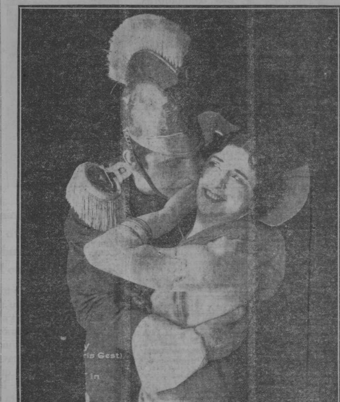
Dejando caer su mantilla "Carmen" completó su obra de fascinación mostrando su incitante busto casi desnudo... poco a poco con movimiento de gata mimosa, fué acercándose al oficial y se dejó estrechar entre sus brazos; pero cuando él, temblando de pasión y de deseo, buscó sus labios, la terrible coqueta, interpuso su mano y dijo: No, eso no, los besos de "Carmen" no se ganan fácilmente...

Santos y Artigas, únicos concesionarios en CUBA de la grandiosa creación cinematográfica "CARMEN-FARRAR," presentarán esta película el VIERNES, en el elegante Salón-Teatro "PRADO," predilecto de la sociedad elegante de la Habana. Las lunetas han sido numeradas y las localidades están ya a la venta en las oficinas de SANTOS Y ARTIGAS, Manrique, 138. Teléfono A-1564. Es imponderable la espectación que hay en la Habana y en toda la Isla, por conocer esta película de la que tanto se ha ocupado la prensa Americana. Geraldine Farrar, ha realizado una proeza de gran mérito, al triunfar como lo ha hecho en la primera película que ha interpretado, y es tan grande, tan genuino su triunfo que un periódico de Boston excita a las casas cinematográficas para que monopolicen a la Farrar para el cinematógrafo, pues esta actriz, dice el periódico, debe lucir sus talentos ante los "muchos" del cine, que no ante los "pocos" de la ópera. Para comodidad del público y para poder satisfacer la inmensa demanda de localidades, Santos y Artigas, celebrarán con este estreno, dos sesiones en el SALON-TEATRO "PRADO" una sesión a las 8½, otra a las 10. No olvidarse: CARMEN-FARRAR, el VIERNES en el Salón PRADO.