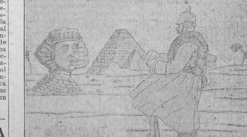
"Le Temps"—La ocupación de Egipto por los alemanes no tiene importancia.