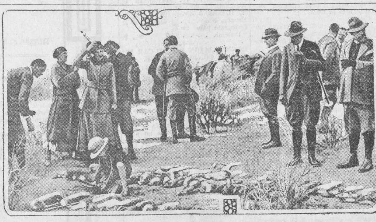
Escena de una reciente aceria efectuada en la hacienda del Duque de Soto Mayor y en la cual tomaron parte el Rey de España y su augusta esposa, la Reina Victoria, que aparece en primer término en el grabado.

Los miembros de la comisión investigadora embarcarán hoy para Cuba. Esperase que, como resultado de esta investigación, se pueda determinar a ciencia cierta qué aranceles se necesitan para proteger la industria de los Estados Unidos y sus posesiones, o si no se necesita ninguno.