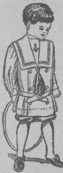
Más de 30 modelos distintos.