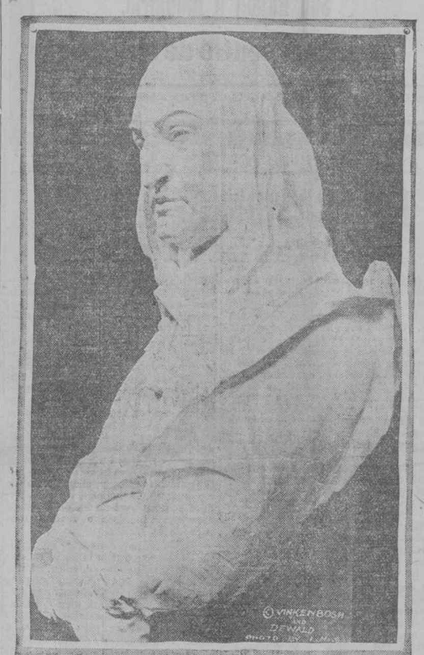
UNA ESPLENDIDA OBRA DE ARTE. Toon Dupuis, famoso escultor holandés, que ordenado por su gobierno ha terminado un maravilloso busto de Pedro Stuyvesant, gobernador de Nueva Amsterdam desde 1646 a 1664...

encrucijadas en su espíritu, ni recovecos en su conversación. En cuanto habla dos palabras, se puede ver el fondo de su alma con la misma claridad que el fondo de la orilla de un río limpio, y reposado.