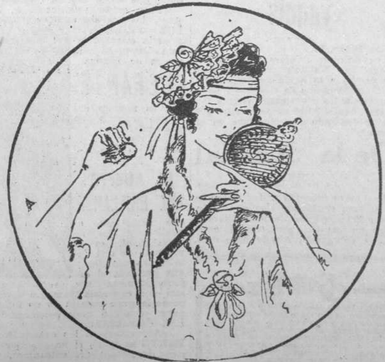
2. Toca con flores de terciopelo, las cuales están actualmente en boga como adornos de los sombreros de paja.

EL CHICO, EL MULO Y EL GATO Pasando por un pueblo un marra- nito (gato) Llevaba sobre un mulo atado un gato, Al que un chico, mostrando disimulo, Le asió la cola por detrás del mulo. —Herido el gato, al parecer sensible, Pegó al macho un arañazo horrible; Y herido entonces el sensible macho, Pegó una coz y derribó al muchacho. Es el mundo, a mi ver, una cadena, do, rodando la bola, el mal que hacemos en cabeza ajena refluye en nuestro mal, por "caram- chola."