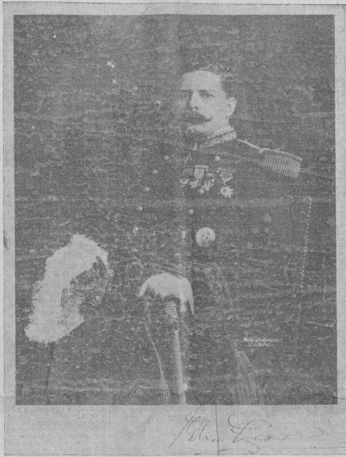
GENERAL FELIX DIAZ.—Político mejicano de alta talla, quien por su intachable reputación e íntegro patriotismo, quizá sea capaz de enfrentar con la anarquía imperante en su país, con beneplácito del mundo nacional honorable y de las naciones extranjeras. Hoy se halla en New York trabajando activamente para salvar a Méjico de la inminente intervención americana.

Con la llegada a New York de los ex-ministros de la Guerra del último Gobierno mejicano, Manuel Mondragón y Aurelio Blanquet, y la conferencia que dichos señores a poco de llegar tuvieron con el general Félix Díaz, completa en la que reinó la más perfecta concordia, indicase que se está preparando un movimiento de reacción con objeto de salvar a Méjico de la actual anarquía que allí impera y evitar la intervención americana en los asuntos políticos y administrativos de la nación azteca.