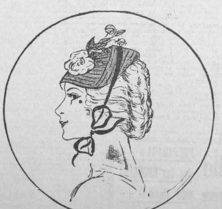
3. Una forma ambigua que no obstante su longevidad, es la "dermler cree."