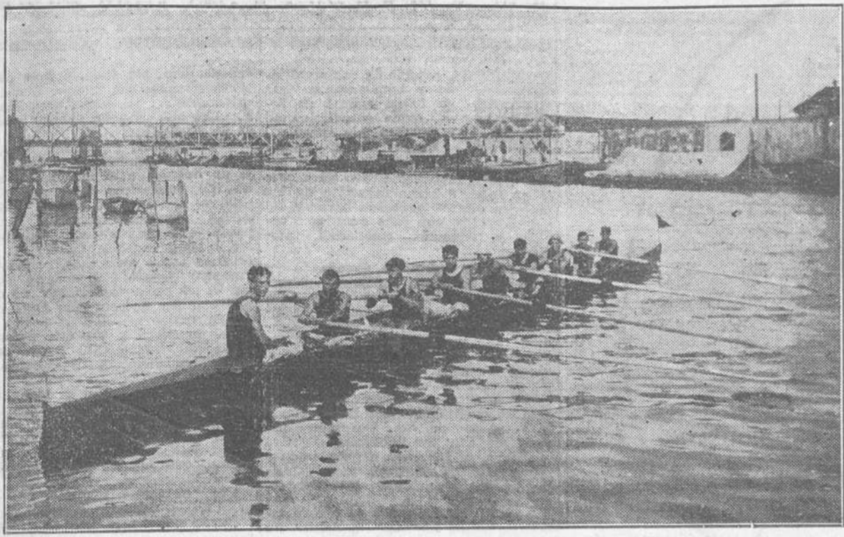
CAÑO DE OCHO REMOS DEL "CLUB ATLETICO DE MAT."

El "Vedado Tennis Club" y el "Club Atlético de Cuba" contendrán como el año pasado. No acude al llamamiento el "Club Atlético de Matanzas". Habrá que unir las buenas voluntades. El "Habana Yacht Club".