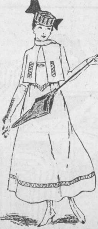
7.—Traje de calle, y sombrero "troiteur," de paja y terciopelo; modelos de verano.