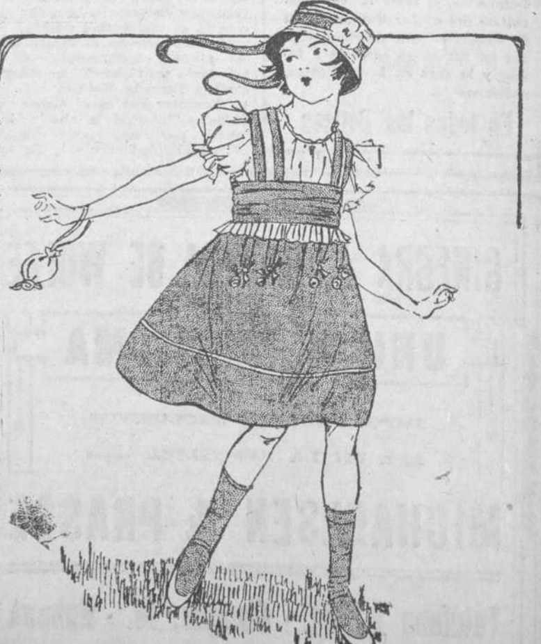
9.—Traje y sombrero para niña; Bolsa o ridículo especial. (Mo. delo Mc. Clure, 1915.)