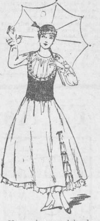
6.—Un curioso modelo de vestido, con adornos de fino encaje; las mangas, y el remate de estas son de alta distinción.