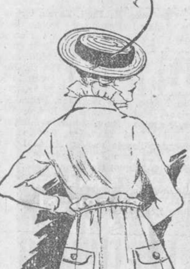
5.—Casaca de fina y fresca tela; con los frunces de moda a la cintura; y con la novedad de sus faltriqueras, bolsillos no simulados sino reales.