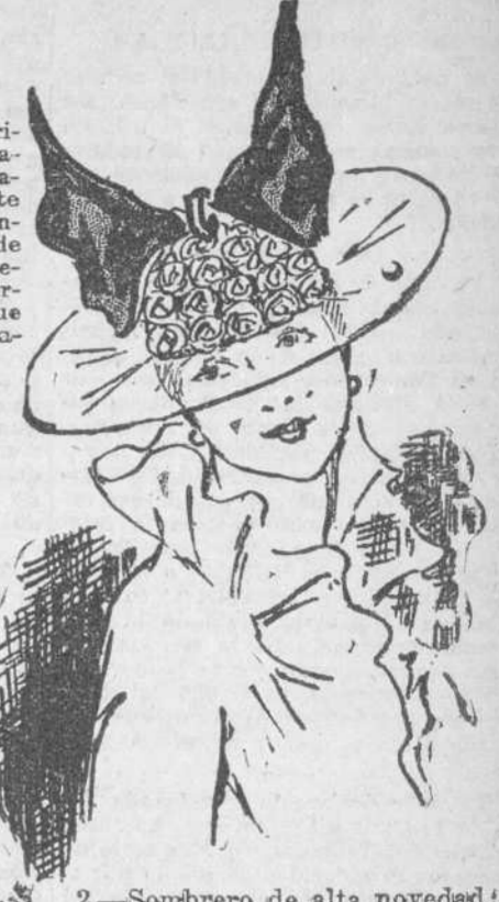
2.—Sombrero de alta novedad; de haldas de transparente encaje; el ceseo de paga, con amplia lazada de color rojo.