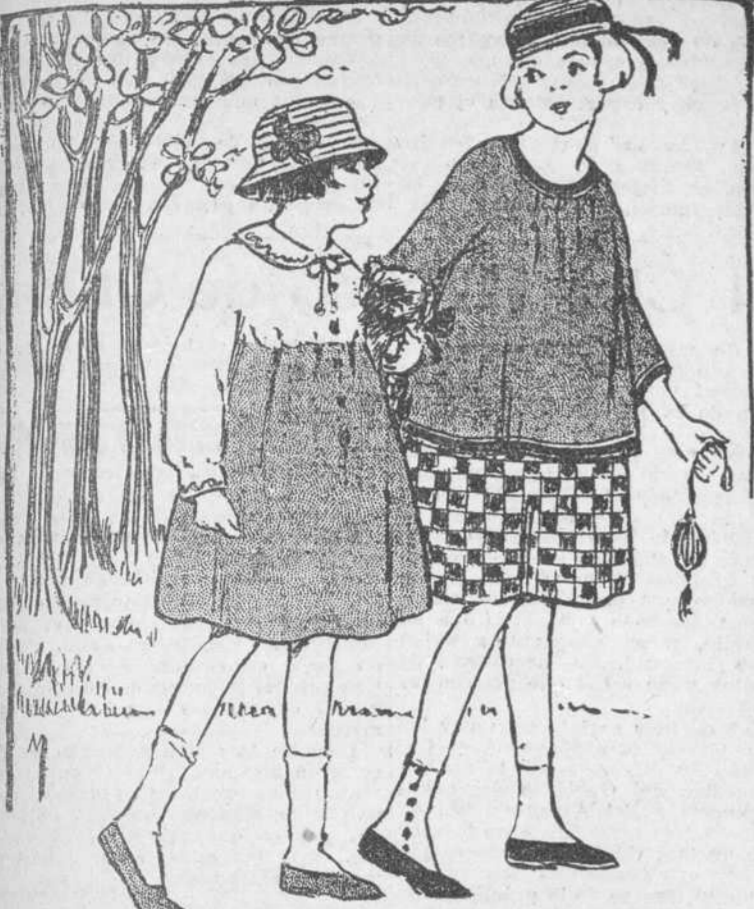
Traje de niño; modelos de vestido y de sombreros; en los cuales se dejan sentir su influencia las modas de los "mayores."