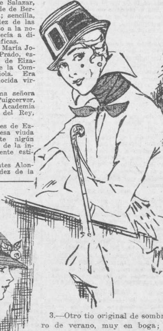
3.—Otro tipo original de sombrero de verano, muy en boga;