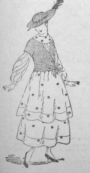
8.—Modelos de la "Maison Jeanne": sombrero y traje de gran aceptación; el más favorecido en esta estación.

Los amigos, sin razón, en cuanto un éxito alcanzas, si lo fueron... no lo son, que en tan crítica ocasión las cañas se vuelven lanzas (1)