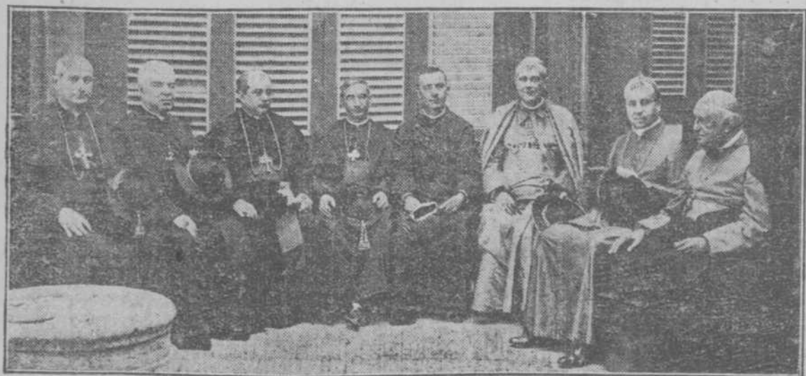
LOS OBISPOS DE CAMAGÜEY, CIENFUEGOS, HABANA, MATANZAS, PINAR DEL RÍO Y SINA CON EL DELEGADO APOSTOLICO, MONSEÑOR NOUEL, Y EL ARZOBISPO DE MERIDA.