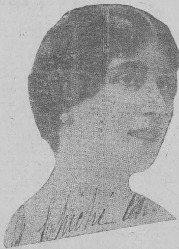
EL "OLIVETTE". — LUCRECIA BORI

Cuando termine su contrato en la Habana irá a descansar a Valencia.—Muerte de un viejo marino español. Los restos de la "Baxter" quemados.—Supervivientes de una catástrofe—Comenzó a mudarse la Aduana.—La Legación de Méjico.