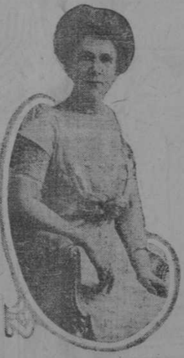
HECHO EN AMERICA. Veinte millones de mujeres llenas de patriotismo, recorren las calles de los Estados Unidos...