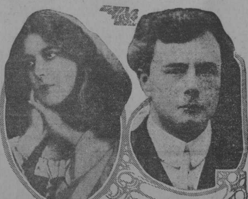
MME. ALDA LA BOHEME JOSEF HOFFMAN BEETHOVEN FESTIVAL