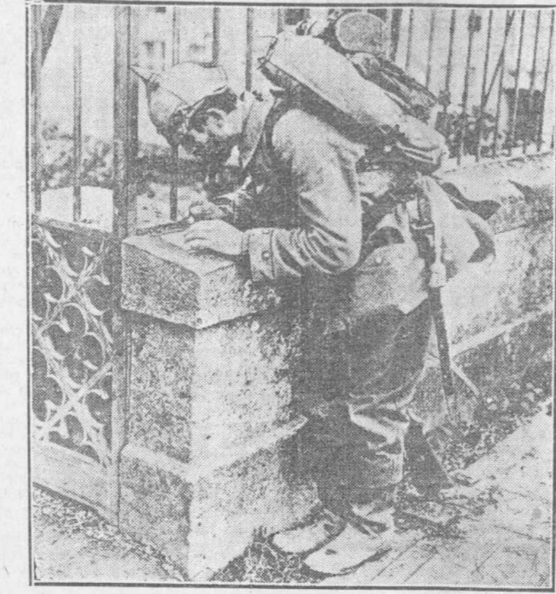
Escribiendo al hogar... ¿Podrá escribir al otro día? ¿No será esta su última carta? ¿Una bala no cortará el hilo de su existencia? "Rogad a Dios que vele por mi vida," es la última frase de la carta escrita en campaña.

Los acusados manifestaron que solamente jugaban de manos.