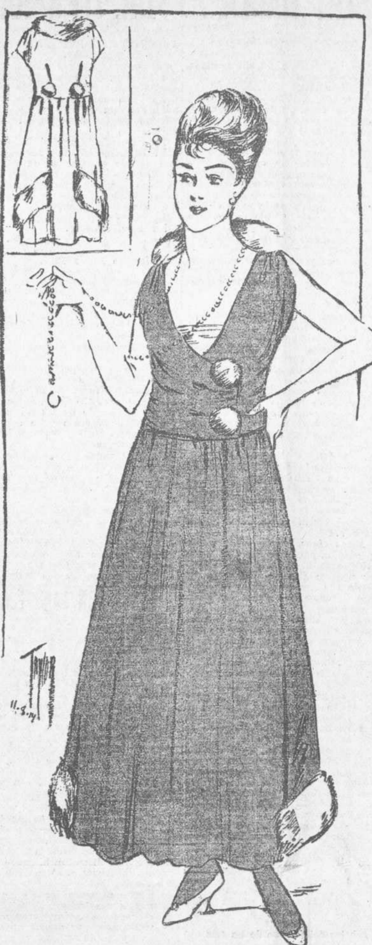
Terciopelo color cereza. Botones de piel blanca. Piel blanca, en el cuello y en los bordes de la falda, en los lugares indicados en el grabado. Mc. Clure.