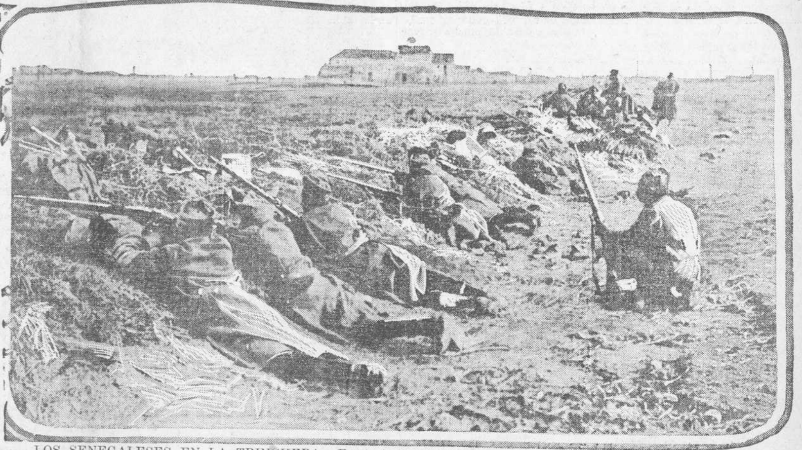
LOS SENEGALESES EN LA TRINCHERA.—Entre todos los soldados que luchan en estos momentos por la existencia nacional y el honor de la República Francesa, ninguno se han distinguido más ni se han hecho más merecedores a la gratitud de la Francia que los héroicos "Rifleros Senegaleses." Estos admirables guerreros negros se han batido siempre en primera línea, y en muchos casos su tremenda acometividad ha triunfado sobre la fuerza numérica de las tropas alemanas. En la carga a la bayoneta, sobre todo, los Rifleros Senegaleses se han cubierto de gloria. En nuestro grabado aparece un destacamento de senegaleses en una trinchera en las cercanías de

ser se halla muy decaído por efectos de grandes accesos de tos. Esta mañana los médicos de la corte le prescribieron un calmante que la empera-