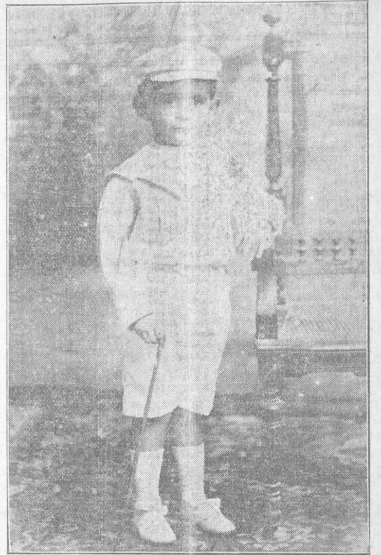
Fotografía Colomina y Compañía.