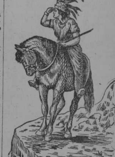
Si quiere tomar buen café pídale a EL INDIO. EL INDIO le servirá el mejor café. Para tomar buen café acuérdese de EL INDIO. Llame A-1280. Se admite café a tostar en grandes y pequeñas cantidades. Neptuno 147. C 4468 30-23-r