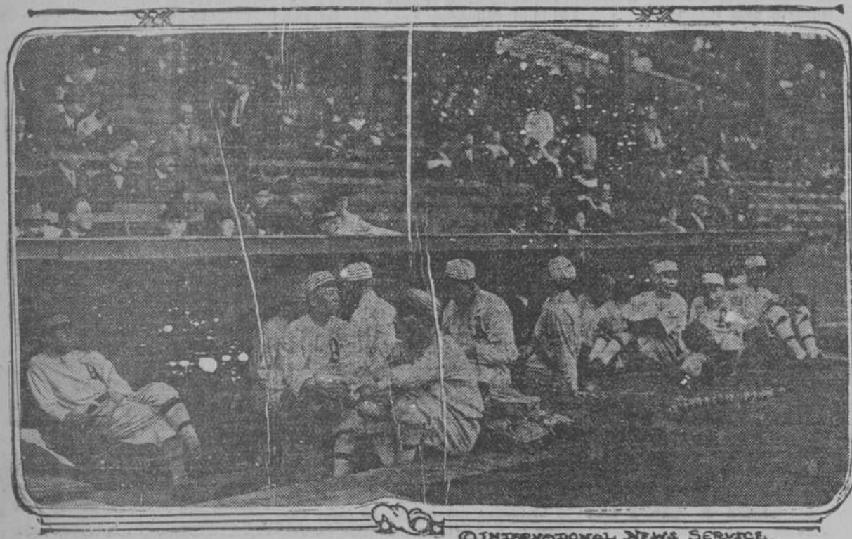
LA TRISTEZA DE LOS VENCIDOS—Esta fotografía fué tomada en el noveno inning del segundo desafío de la serie mundial y ella aparecen los jugadores supletivos del "Philadelphia," en el banco, y, como puede verse, más tristes que si acabaran de darles la noticia de que habían sido declarados cesantes. Obsérvese que la parte del gran stand situada sobre el banco está desierta. Esto obedece a que los espectadores que la ocupaban, no queriendo presenciar los últimos momentos de la derrota de su club predilecto, han tomado el partido de marcharse.