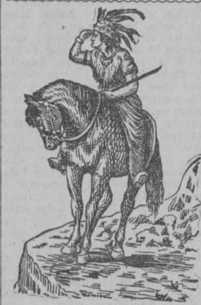
Si quiere tomar buen café pídale a EL INDIO. EL INDIO le servirá el mejor café. Para tomar buen café acuérdese de EL INDIO. Llame A-1280. Se admite café a tostar en grandes y pequeñas cantidades. Neptuno 147. C 4468 30-23-0