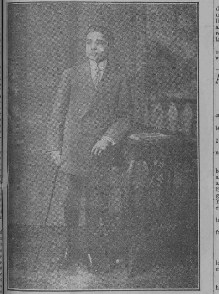
Fotografía Colominas y Compañía Luis F. Calzada

Inteligente y estudioso niño que cursa con gran aprovechamiento la segunda enseñanza.