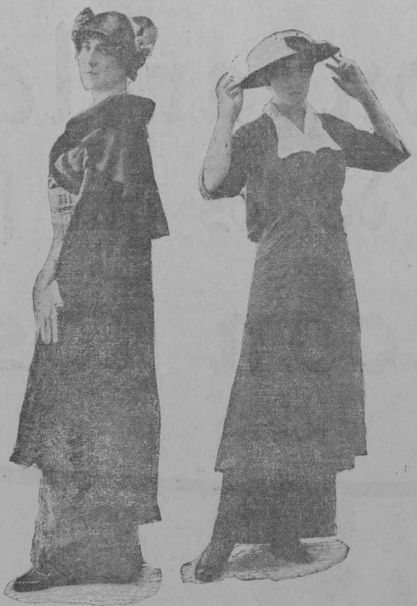
NOVISIMO MODELO DE CAPA TRAJE CON CUERPO CRUZADO SOBRE LARGA TUNICA Y CUELLO BLANCO VUELTO BORDADO

devojar mis laucinantes inquietudes. Tengo miedo de la noche silenciosa que penetra de frío la médula de mis huesos, miedo de la negrura intensa que me rodea. El lecho de mis bodas espirituales, yo lo había engalanado para la desconocida esposa; en él esparcí pétalos de rosa, y con gomas de Arabia sahumié la estancia. Mas ella no ha venido, la que hubiera dado calor de hogar a mi cámara, de tálamo a