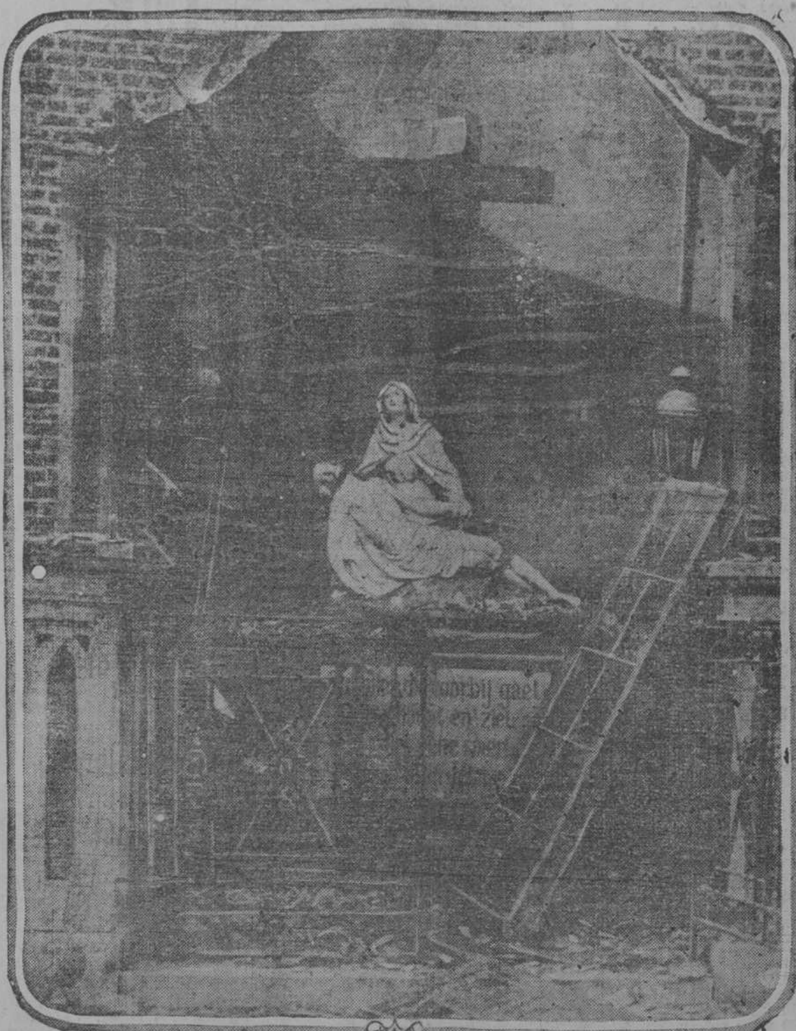
IMAGENES SAGRADAS RESPETADAS POR LAS BALAS.—En el interesante grabado que ofrecemos pueden admirar nuestros lectores uno de los grupos escultóricos de carácter religioso más famosos que venera la Iglesia Católica: "El Descendimiento" que por espacio de muchos siglos se ha conservado en la histórica iglesia de la "Bequinage", en Termonde, Bélgica. Durante el tercer bombardeo de esta ciudad por las tropas alemanas, los artilleros del Kaiser, quienes, por el visto, están animados de un inexplicable espíritu de destrucción de monumentos religiosos, dirigieron deliberadamente el fuego de sus grandes obuses de 16 pulgadas contra la iglesia de la Bequinage, que fué reducida a escombros. Sin embargo, por una coincidencia extraordinaria, que el pueblo belga atribuye a un verdadero milagro divino, el precioso grupo escultórico de referencia no recibió el menor daño. Ni las granadas alemanas, ni los derrumbes ni las llamas del incendio, osaron destruir esa maravillosa obra del arte cristiano, que hoy se levanta, más bella e imponente que nunca, entre los escombros que la rodean.

DESPERACION DE OSTENDE Londres, 15. Ostende es hoy una ciudad desierta. Los muelles están atestados de multitudes aterradas huyendo a los alemanes ansiosos de alejarse todo lo posible de esas escenas de sufrimiento y desesperación.