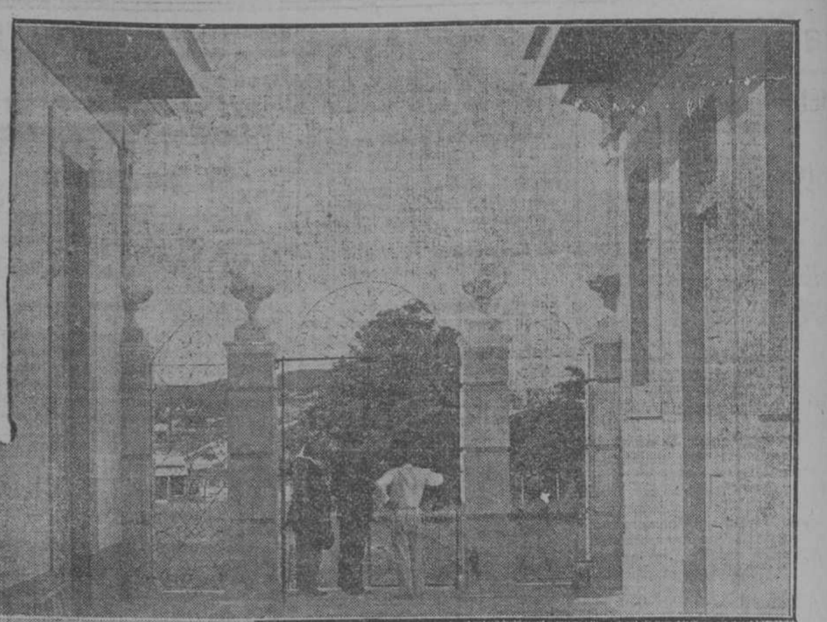
PANORAMA QUE SE DIVISA DESDE LA PARTE POSTERIOR DE LA GRANJA.