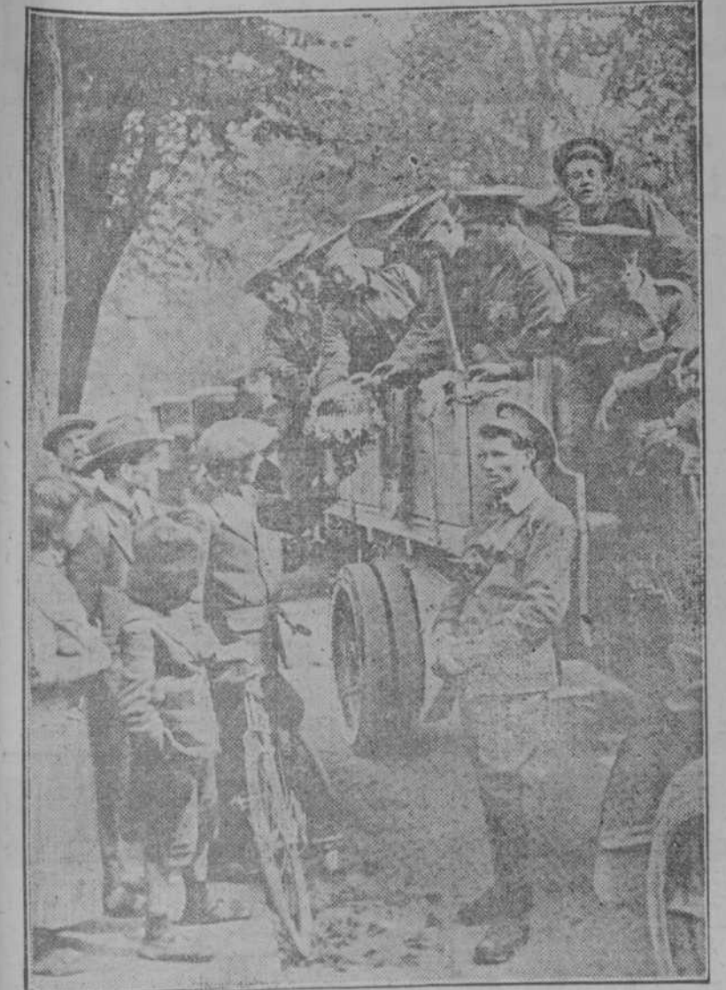
AL PASO DE LOS SOLDADOS ING LESES POR LAS CIUDADES, PARA EL CAMPO DE OPERACIONES, LOS FRANCESES LOS VITOREAN Y LES OFRECEN FLORES.