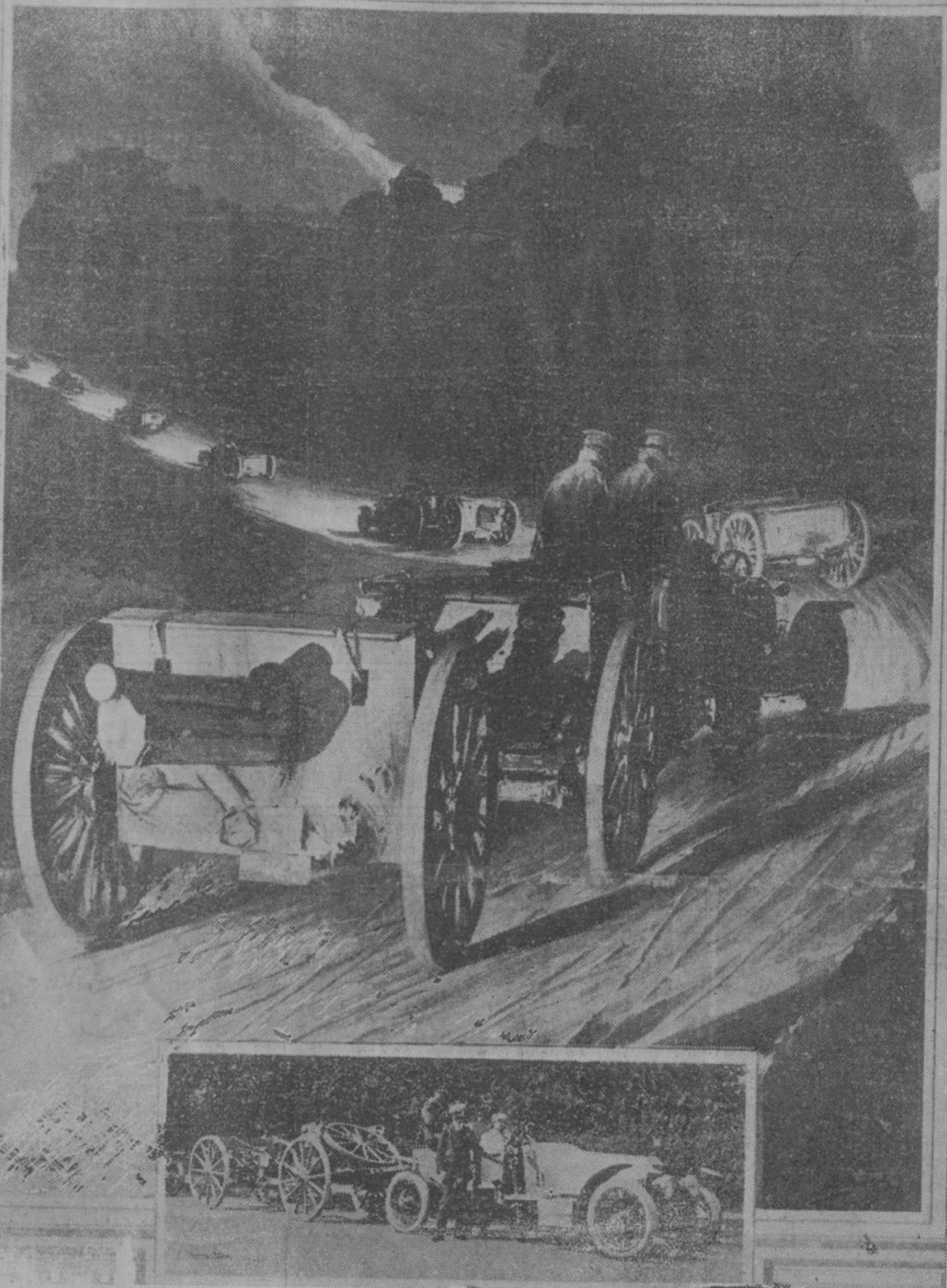
EL AUTOMOVIL EN LA ARTILLERIA INGLESA

Nueva máquina portadora de cañones para sustituir a la artillería montada.