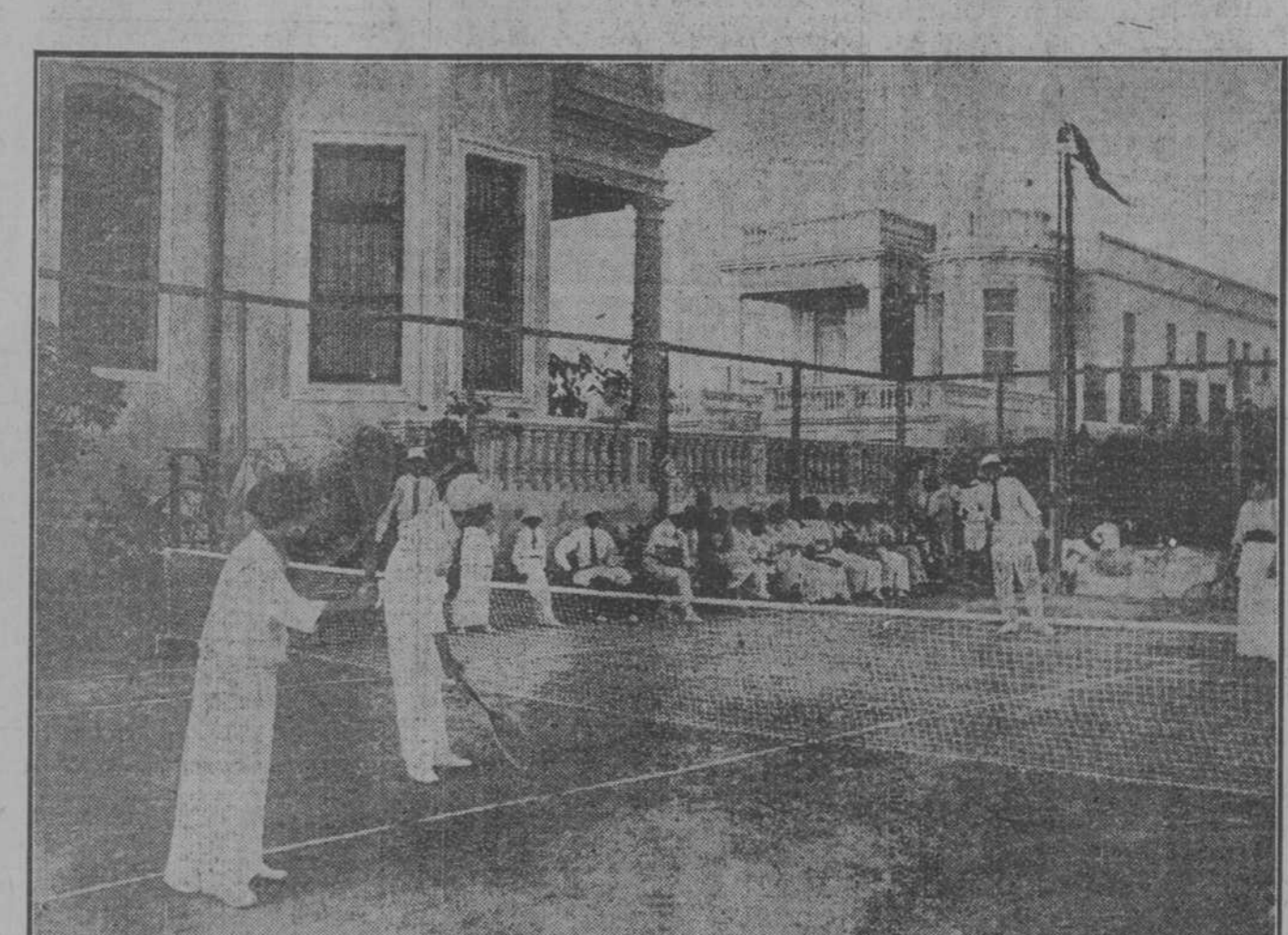
EN EL LOMA TENNIS CLUB.— EL PRIMER PARTIDO

Se ha inaugurado con gran éxito el Loma Tennis Club. Gran número de señoritas y jóvenes de la "high life" tomaron parte en las partidas, organizadas y prestaron esplendor con su presencia al acto.