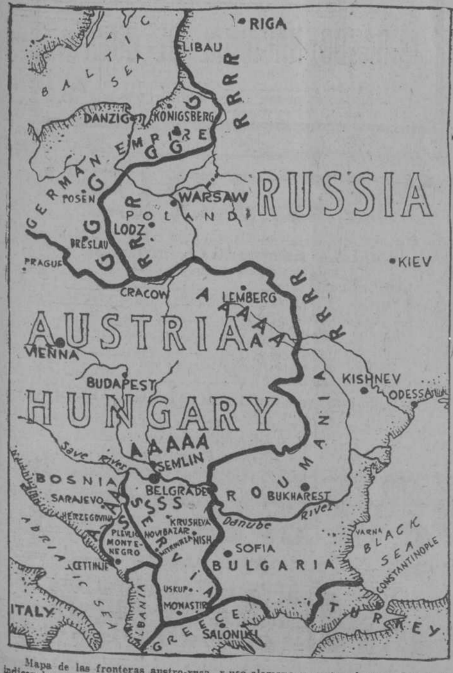
Mapa de las fronteras austro-rusa, ruso-alemana y austro-alemana. Las letras indican la posición de las fuerzas. R, Rusia y G, Alemania; A, Austria; S, Servia.