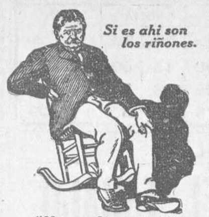
"No me dá respiro."

Un Mal Dorso y Unas Coyunturas reumáticas, quieren decir Misericordia Inseparable.