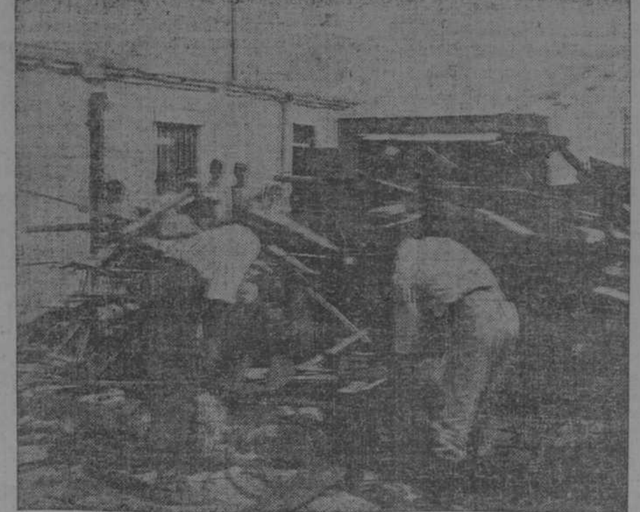
LAS BASURAS Y OBJETOS INUTILIZADOS AMONTONADOS EN LA AZOETA DEL EDIFICIO, QUE IBA A LANZARSE A LA CALLE.

Bolsa de New York De la Prensa Asociada. Mayo 8 ACCIONES... 299.080 BONOS..... 1.900.000 Edición de Wall Street A las 3 p. m. ACCIONES... 297.400 BONOS..... 1.685.000 A la hora del cierre ACCIONES... 297.400 BONOS..... 1.712.000