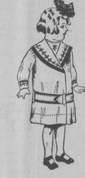
Batita de buen warandol, en todos colores, con bordados. Reclame a 98 cts.

SABANAS con dobladillo de ojo, cámaras, a 98 cts. Fundas a 25 centavos.