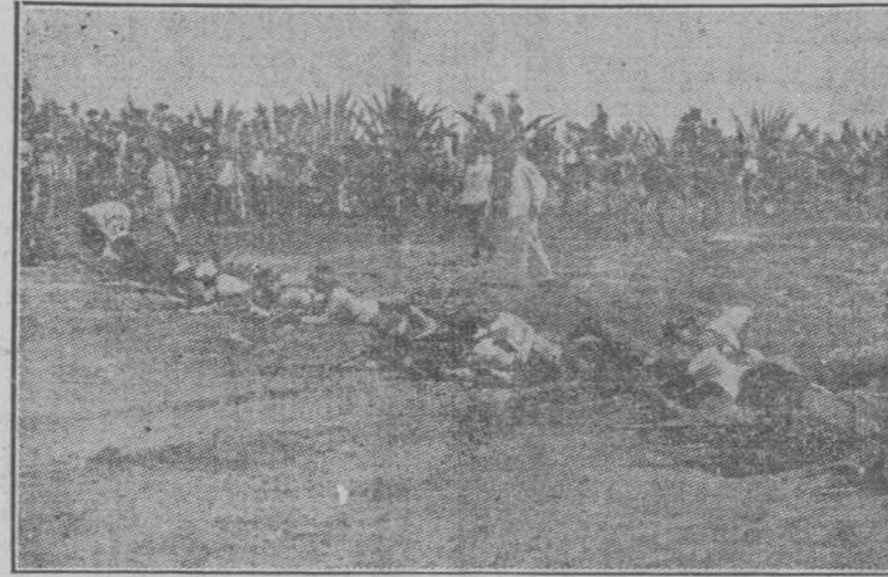
LA ACTUALIDAD MEJICANA. Constitucionales en campaña.

Naciones que figurarán en las conferencias.-El papel de árbitro le es reservado a Alemania.-Los americanos detenidos no han sido conducidos a Veracruz, sino a Puerto Méjico.-Suspensión de hostilidades.