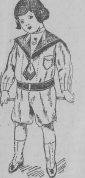
Trajecitos de drill superior, con adornos prusia o punzó, para 2, 4, 6, 8 y 10 años. Desde $2-68, según edad.