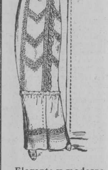
Elegante y moderna Bata de nansu frances y finos encajes. UN CENTEN

La única casa en la Habana dedicada EXCLUSIVAMENTE a confecciones para señoras y niños. Surtidos enormes. Precios reducidos.