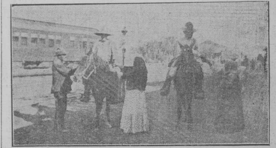
LA ACTUALIDAD MEJICANA. Constitucionales haciendo investigaciones en un pueblo.

El herido, pues, fué el único prisionero.