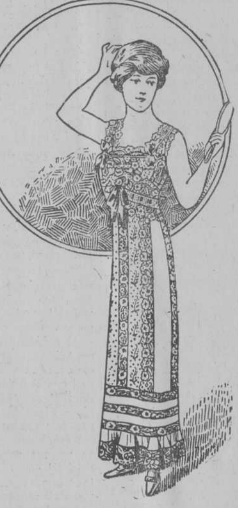
Elegante combinación muy adornada de finos encajes, a $ 4-50.

Ropa interior para señora y niña, tanto de algodón como de fino olán y hecha a mano.