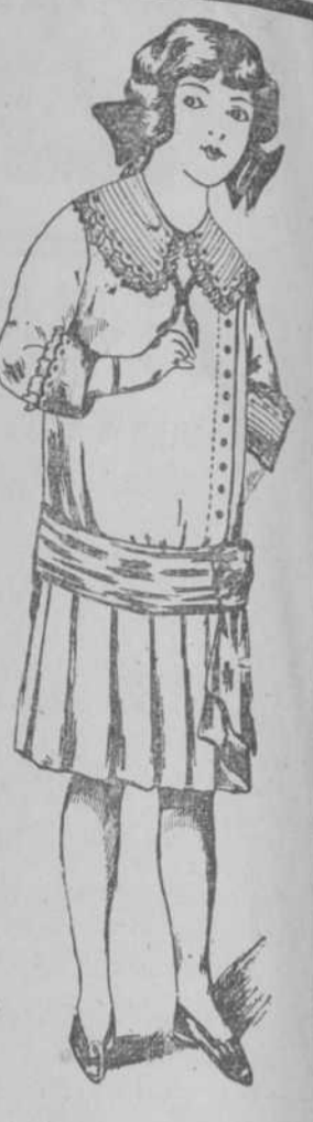
Vestido de moderno piqué de cordón, ancho cuello, banda y puños de volé festonado y bordado con seda. Plisés tul y botones stras en rosa, azul beige y blanco. $ 3-50 para cuatro años y 25 cts. de aumento por edad.