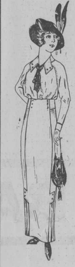
Nuevo vestido de Vichy punzó o prusia, adornos otomán blanco y corbata de seda negra para señora y jovencita a $ 1-98.