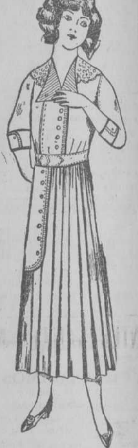
G. 292. Vestido de Vichy azul o punzó. Adorno piqué blanco y cuello fino. Para 10 años $2-10. " 12 " $2-20. " 14 " $2-30. " 16 " $2-40.

ABIERTO LOS SABADOS HASTA LAS 10 DE LA NOCHE. LOS TRANVIAS PASAN POR DELANTE DE ESTOS ALMACENES.