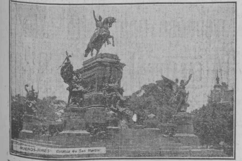
Buenos Aires.—Notable monumento que acaba de erigirse al invicto general San Martín.