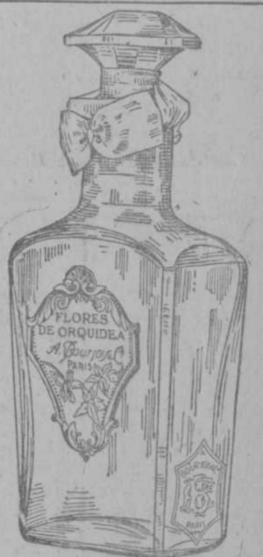
Flores de Orquídeas el perfume favorito de la Sociedad Londinense, la flor preferida por Lord Chamberlain, el célebre ministro inglés. Esencia, polvos y loción. No hay nada igual ni más nuevo. De venta en todas partes. Al por mayor, LAS FILIPINAS, San Rafael 9. Teléfono A-3784. C. 1343