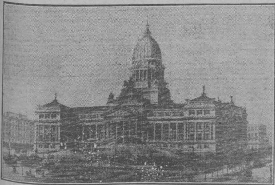
EL CAPITOLIO DE LA REPUBLICA ARGENTINA.

En el año de 1897, el Gobierno comenzó la construcción del nuevo edificio para el Congreso Nacional y a principios de 1906 ya lo tenía parcial-