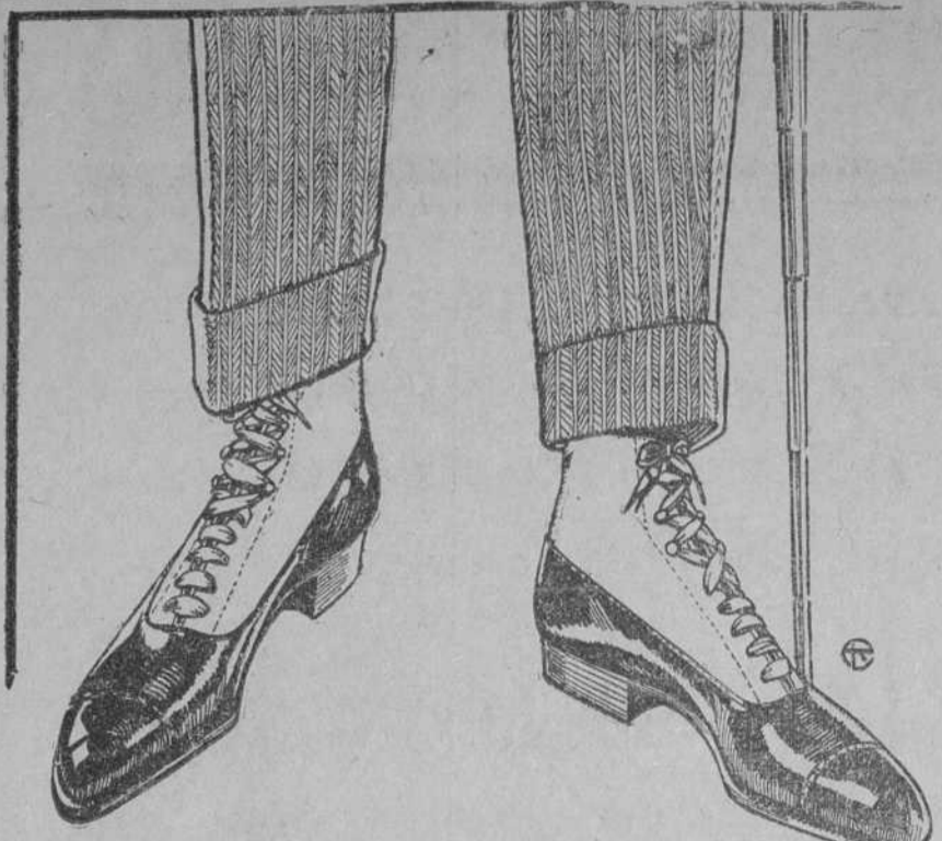
MODELO INGLES, lo más nuevo y moderno en Cuba

Hay en charol y cañas piel rusia. UNICO ZAPATO FINO-GRATIS " " " " mate. LOS PEDIDOS AL INTERIOR. " " " " rusia obscura