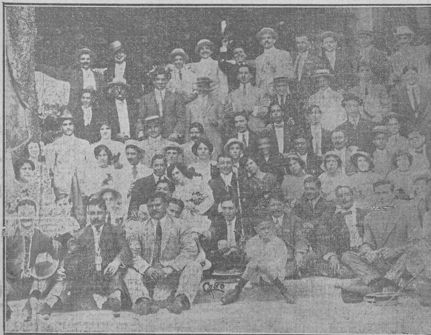
Grupo de concurrentes a la jira del Club Grandalés.