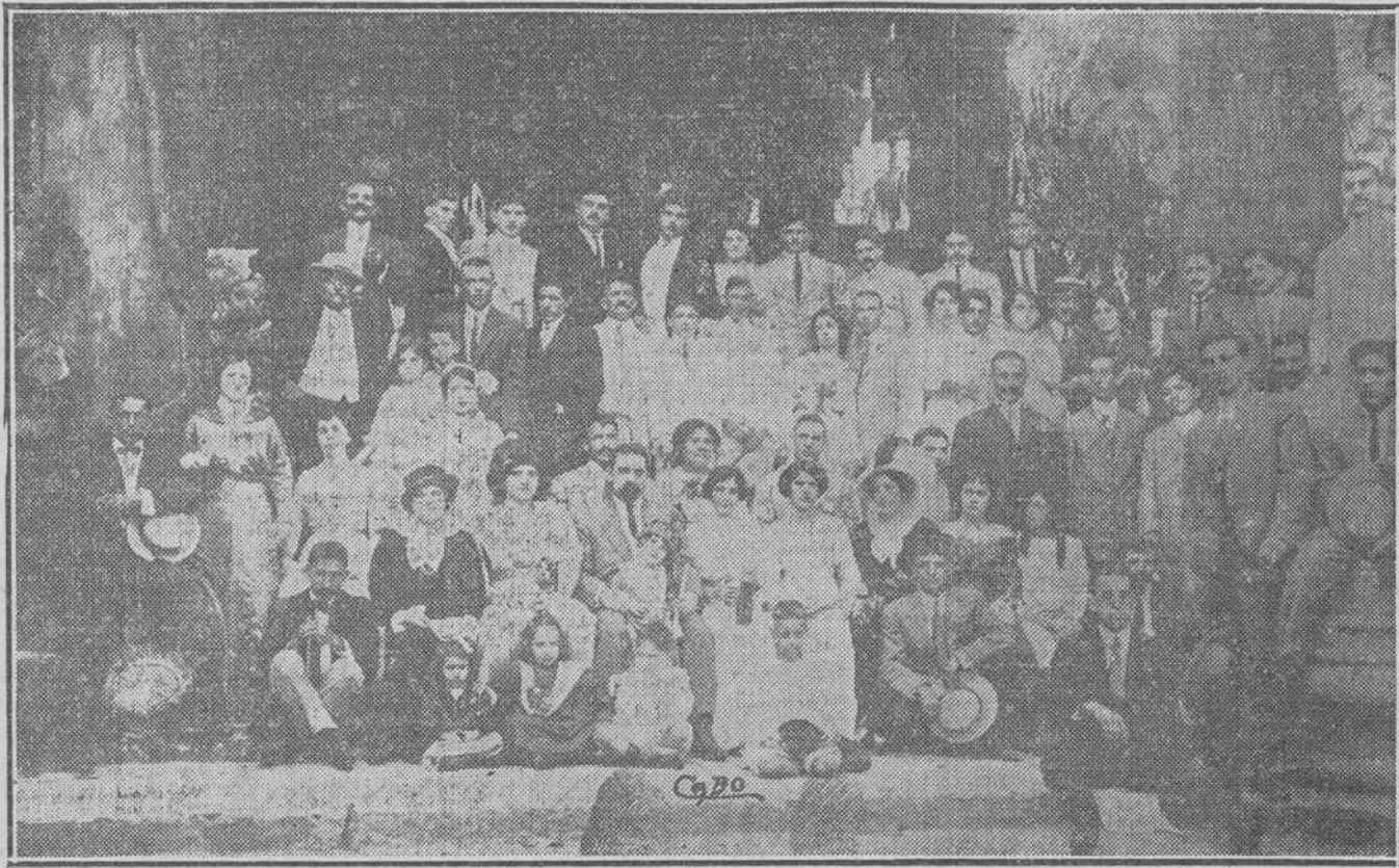
El Presidente del Club Grandalés acompañado de un grupo de concurrentes a la jira.