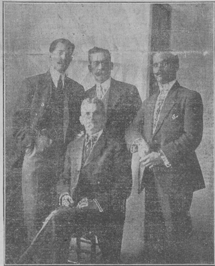
Los nuevos talleres de "La Moderna Poesía".—Los funcionarios inspectores del Estado. (Léase nuestra reseña.)

Este procedimiento de multiplicar los grabados fué inventado hace muchos años por un americano llamado Jacobo Perkins, hombre ingenioso a quien puede considerarse como el padre del sistema actual de multiplicar placas de billetes de Banco y de sellos del Estado. Este sistema de multiplicación consiste en hacer un molde invertido del grabado original en un rodillo que se hace girar sobre el grabado en la prensa de transferencia. Guiado con precisión y asegurado por el mecanismo de la prensa, las continuas vueltas, bajo alta presión, hacen penetrar el acero dulce