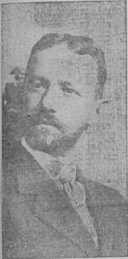
General Mario G. Menocal

orden en su clase, puede decirse que la primera de la República latina. El período presidencial del general Mario Menocal tendrá un timbre más de esplendor con la inauguración de los talleres nacionales para fabricar sellos de correos. Cuba será de las pocas naciones que hacen las emisiones de sellos en su propia nacionalidad. Ya los sellos de Correos de Cuba y los del Impuesto del Empréstito no se fabricarán en los Estados Unidos. La rebaja obtenida es de un quince por ciento.