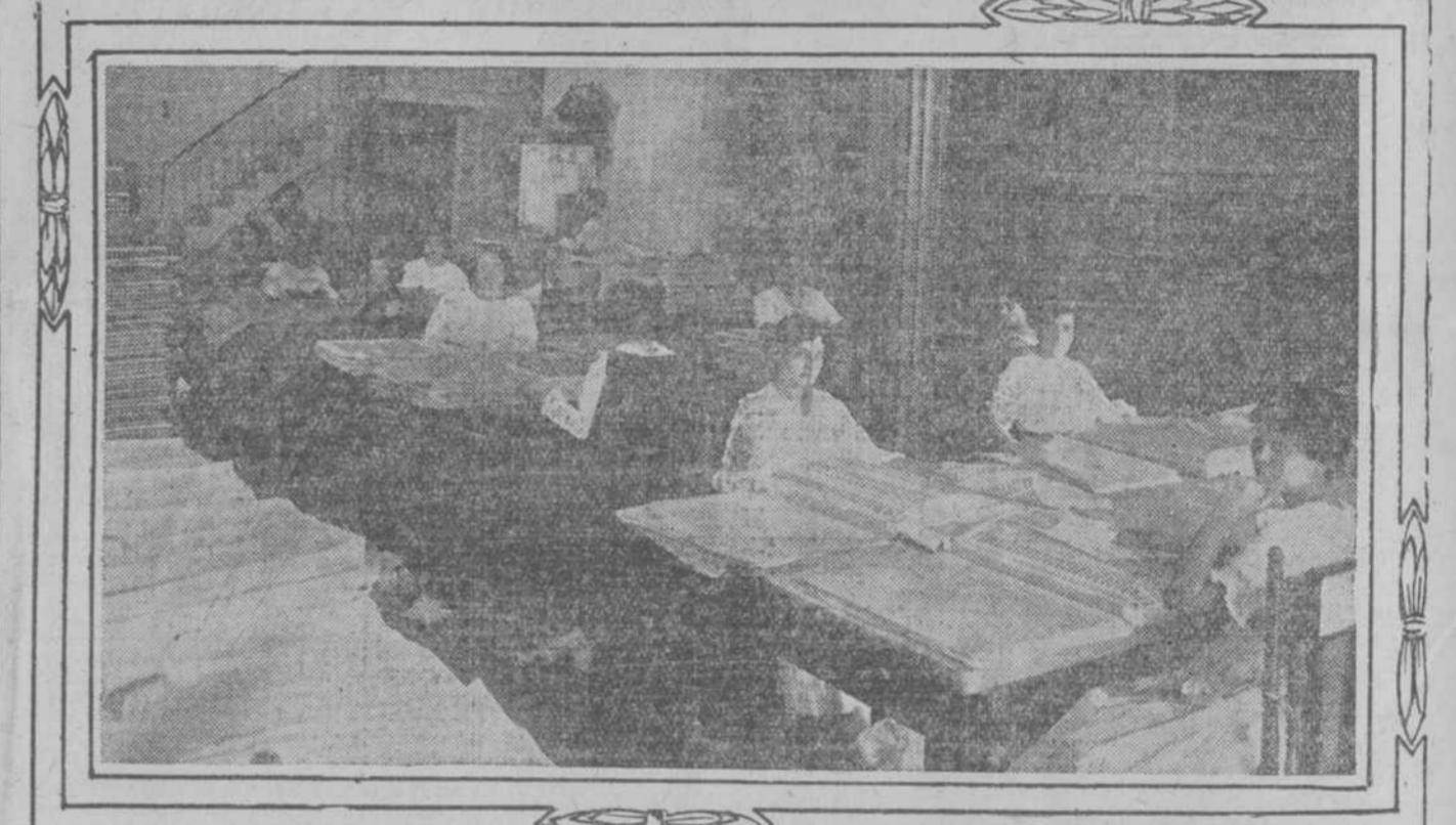
Los nuevos talleres de "La Moderna Poesía".—Departamento de empaquetado.