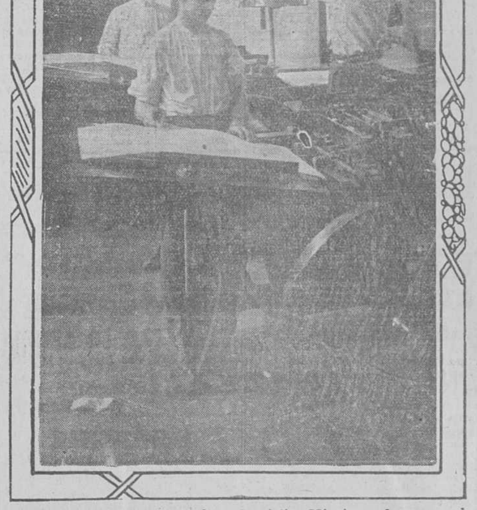
Los nuevos talleres de "La Moderna Poesía".— Máquinas de engomado.