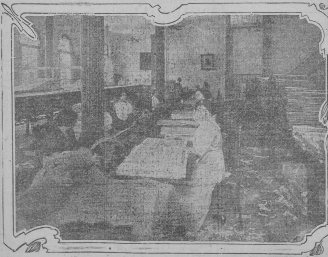
Los nuevos talleres de "La Moderna Poesía".—Taller de taladrado.