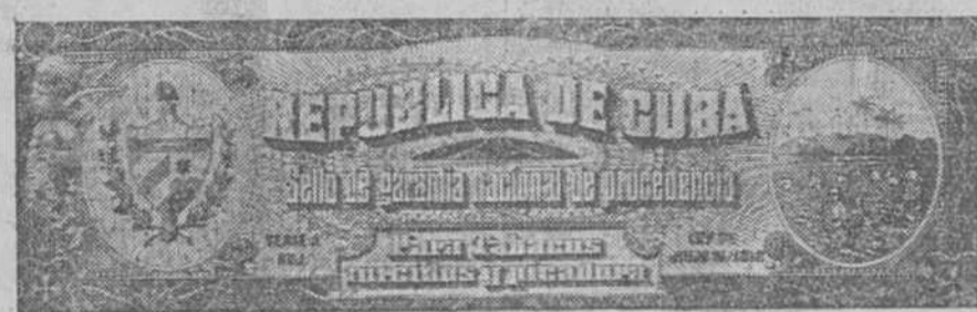
Los nuevos talleres de la "Moderna Poesía".—Sellos nuevos de garantía para tabacos y cigarros.

diferencia de la pintura y de la escultura, en cuanto que el grabador que hace el trabajo en dichas placas de acero, tiene necesariamente que