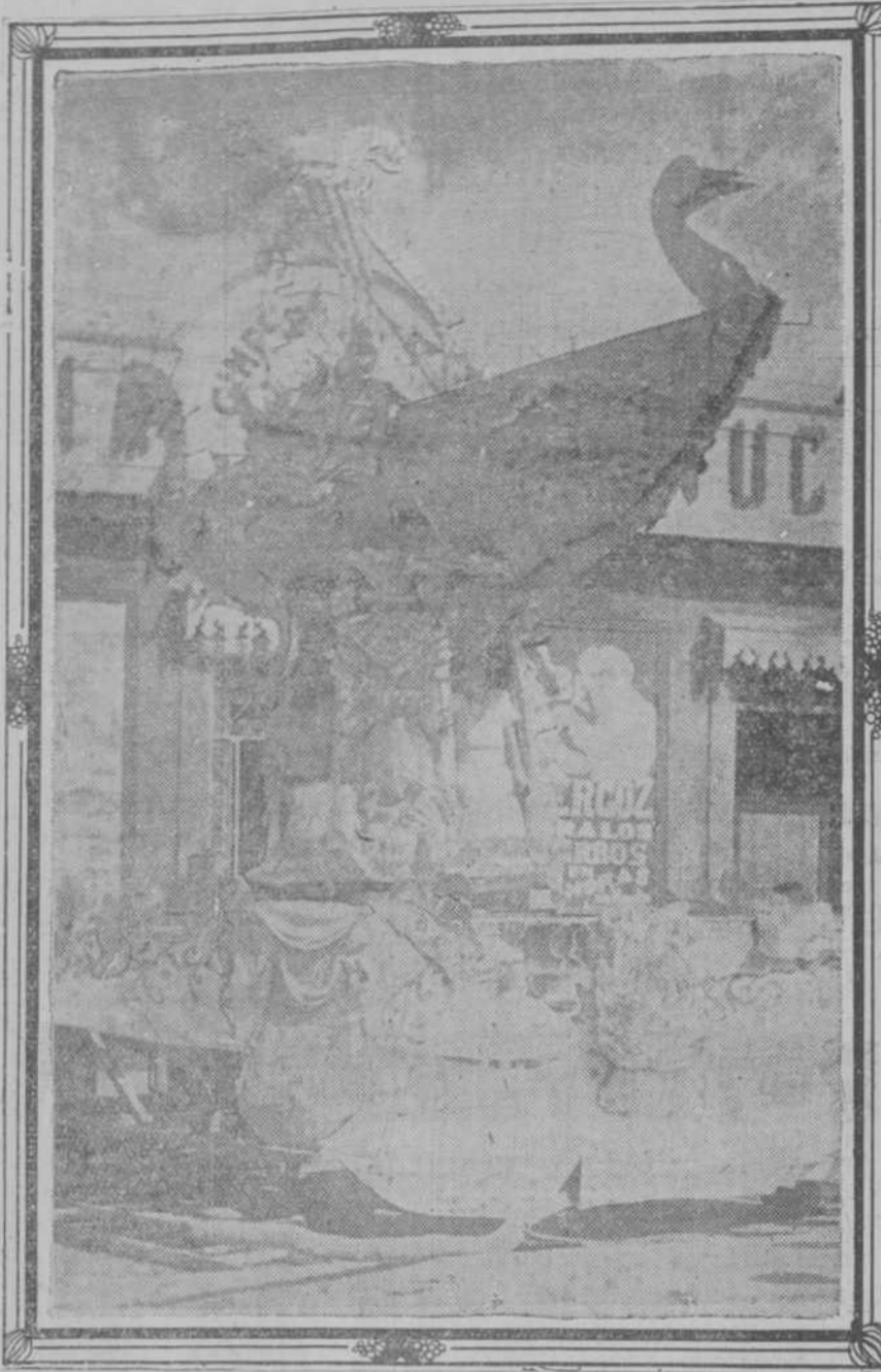
GONDOLA ENCANTADA. Carroza triunfadora del bando azul en las fiestas celebradas recientemente, y que oportunamente reseñamos.