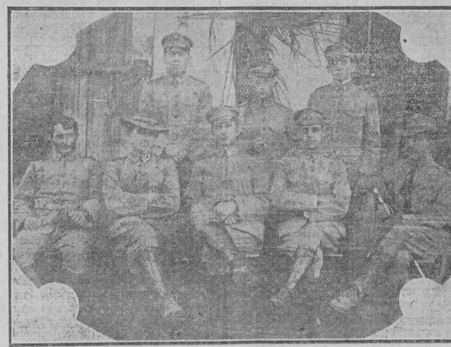
Grupo de oficiales que están al frente de las fuerzas militares destacadas en Pinar del Río. Véase en la 6.ª página la reseña del banquete, que nuestro activo corresponsal Sr. Hernández nos ha enviado.