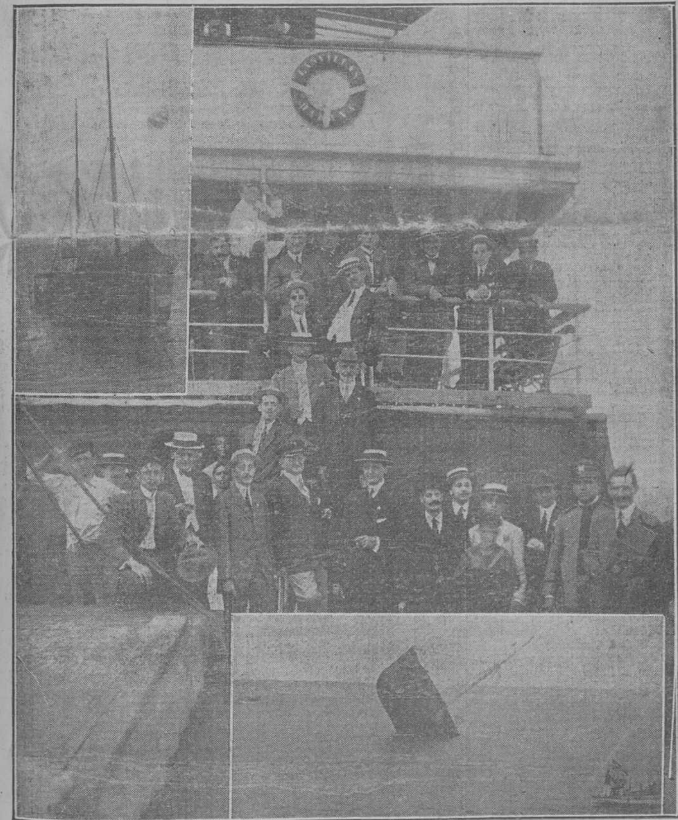
En la parte superior: el vapor "Cosme Herrera" cuando iba remolcado; en el centro, un aspecto de la concurrencia, y debajo el "Cosme" en el momento de hundirse.

En el mesana otro con el año actual de 1914.