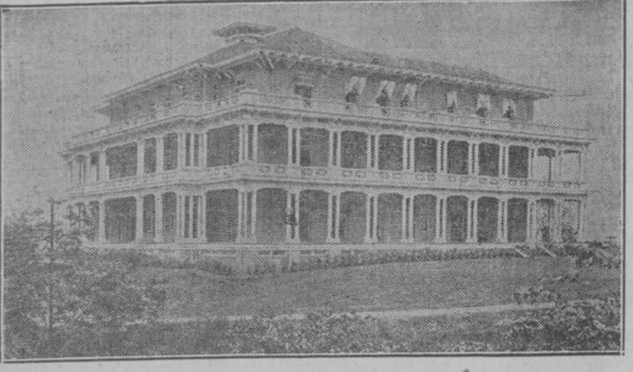
EDIFICIO DE LA ADMINISTRACION DEL CANAL.—PANAMA

Colombia); los que en la rue de Chaurmartin, en París, donde estaban instaladas las oficinas del canal interoceánico, tuvimos la honra de hablar en castellano con el inmenso don Fernando, bajito de estatura, de bigote blanco, corto y estrecho, recordamos esta frase suya: "El canal se construye a prueba de terremotos. No olvidamos los ingenieros y yo que Centro América es el nido donde se incuban las trepidaciones sísmicas".... Los últimos terremotos ocurridos en Centro América y Panamá, causaron desplomes, hundimientos y enormes grietas en la costra terráquea, tan enormes grietas, que abismos insondables parecen... Vértigo produce el asomarse a ellas. El Canal de Panamá, enlavado en el mismo radio en que se manifiestan los temblores, es un amenazador alarde de ingeniería. El Canal de Panamá, dice el notable ingeniero Boreau Basilla, "desaparecerá tragado por el agua salada de los dos mares".... El canal a nivel ofrece menos peligros ante los terremotos. Construido por el sistema de esclusas, es un amago de hecatombe... y cuándo sucederá la catástrofe! Al correr de los tiempos, los pueblos cambian de política, cambian de procedimientos, cambian de doctrinas y hasta cambian de geografía. ¿Cambiará Nicaragua de geografía física?! Otro canal hay en proyecto, y quién sabe si otra nueva nación, y otra nueva constitución, y otra nueva bandera.... En el universal concierto de los pueblos, se dan sorpresas que desconciertan....!