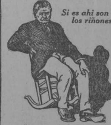
Si es ahí son los riñones.